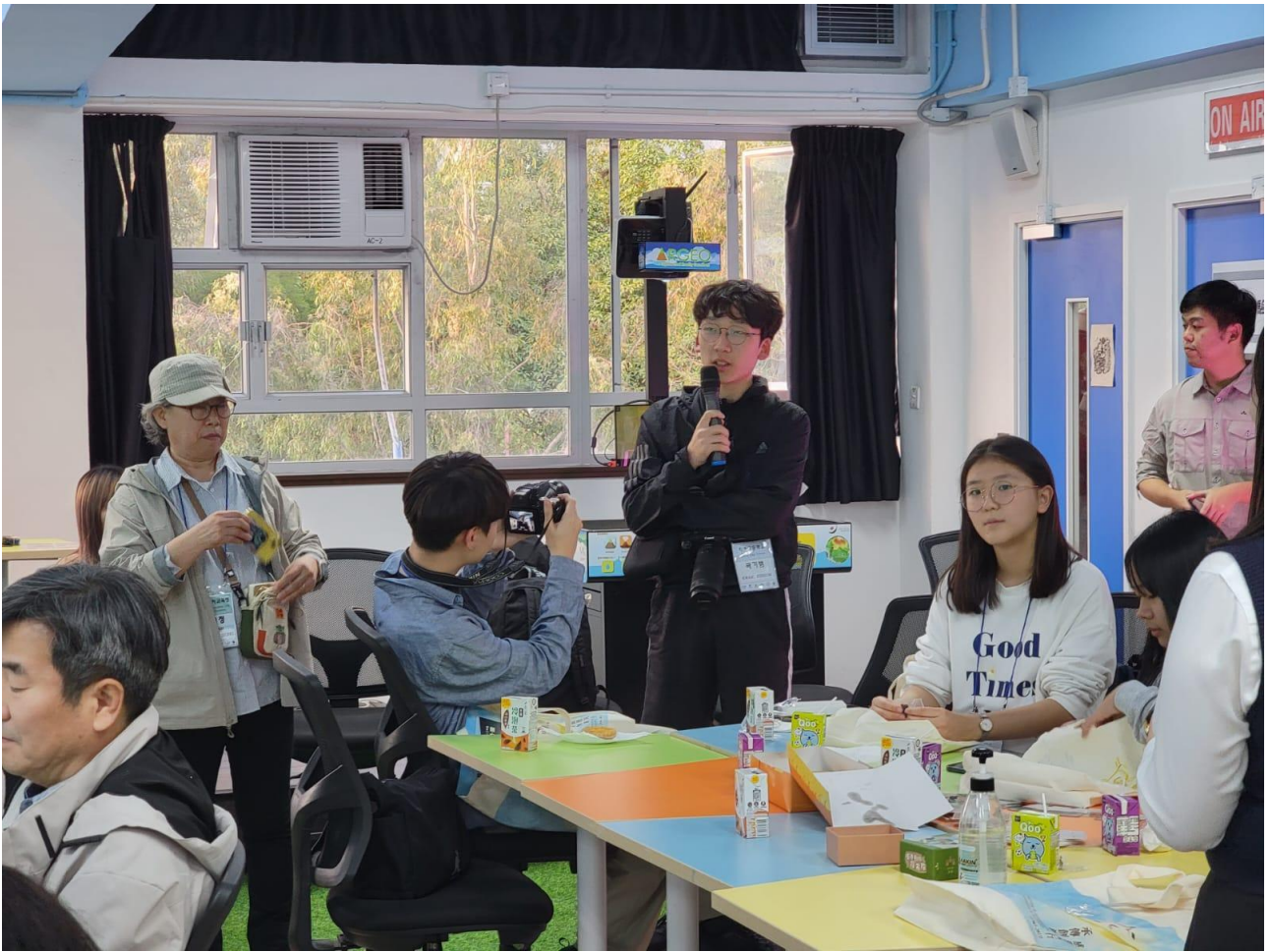
12. 本校榮獲香港旅遊博覽會全港傑出學校遊學團嘉許2024殊榮