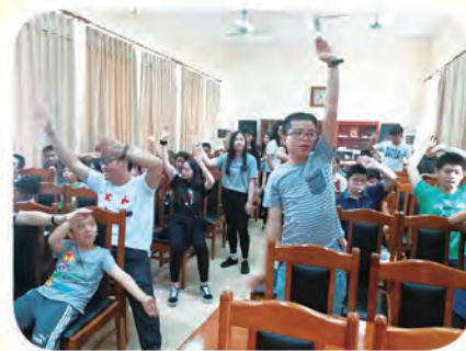
同學與智障孤兒一同玩遊戲

當我去到孤兒院時，發現有些小朋友的身體上或智力上有些缺憾，所以父母就把他們遺棄了。聽院長分享說，有一些媽媽有了小孩，她們不想要，對他們不聞不問，甚至遺棄，我一邊聽一邊感到心酸，希望這些小朋友會有人去照顧他們，找到一個疼愛他們的養父母。最後，完結整個行程，我心裡默默祝福這些孩子能快高長大，事事順意、身體健康。經過這次義工團，大家都能體會到團結和服務是甚麼意思，其實我有成為社工的目標，因為想以服務他人為職業，幫到別人，自己也開心。所以，日後我也會積極參與幫助別人的義務工作，吸取更多的經驗，達成自己的目標。