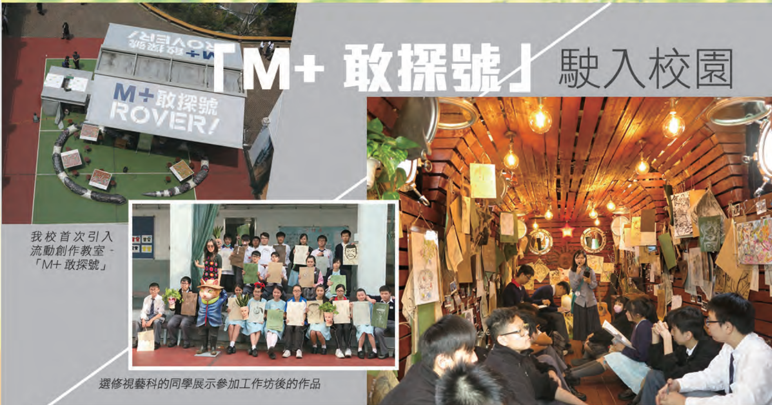
我校首次引入 流動創作教室 - 「M+ 敢探號」