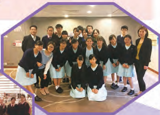
最後與餐桌禮儀導師及酒店經理合照