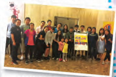
一眾社工及家長專誠到來為支持同學參賽