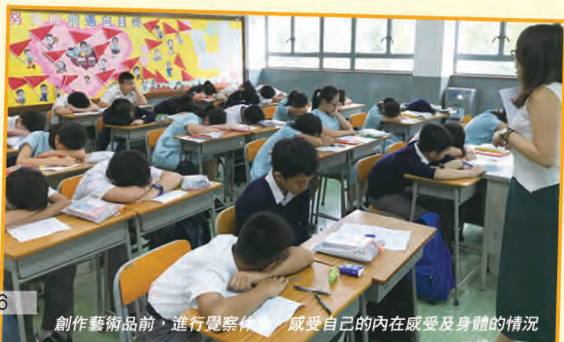
創作藝術品前，進行覺察練習，感受自己的內在感受及身體的情況