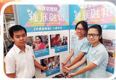
同學向社區居民介紹自己創作的畫作

透過與作家及插畫家謝曬皮導師的指導下，同學與其他參加者前往西營盤與當地居民交流，把所見所聞所感，轉化漫畫及一系列作品放送，有關此活動的紀錄亦會印製成《社區漫畫報》於區內外免費派發。