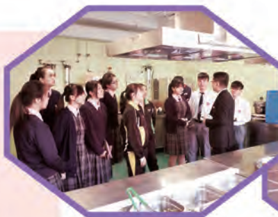
同學參觀酒店廚房的運作情況