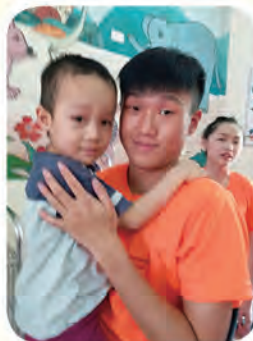
同學十分喜歡越南孤兒