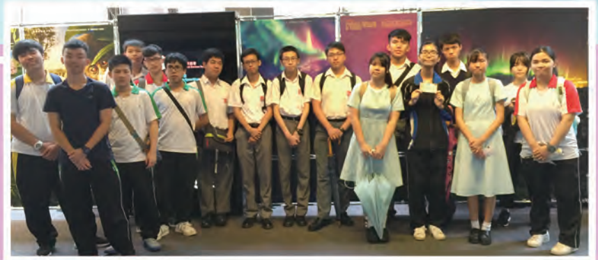
中四物理班欣賞節目前合照

透過是次全港性比賽，同學可與其他中學生互相切磋與交流，藉此提高同學對物理的興趣及學術水平。