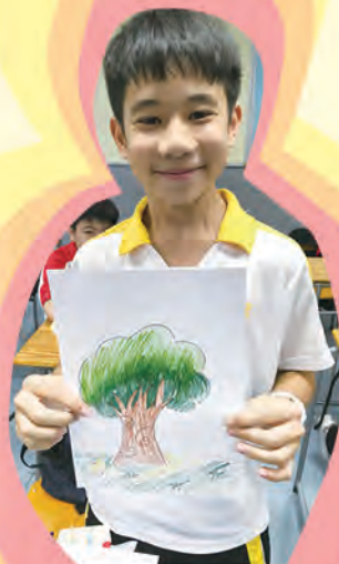
同學正展示其藝術作品

在社工及藝術治療師的帶領下，第一次「觸動心靈系列」班訪已於9月12日舉行，對象為全級中二級同學，期望透過創意藝術治療 (Creative Arts Therapy)，讓我校同學進一步了解和表達自己的情緒和想法，促進個人成長。