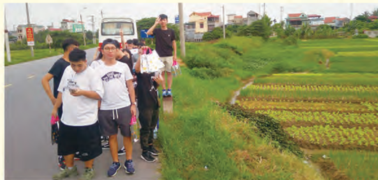
同學親自到農地贈送小禮物給農民，並感受他們在酷熱天氣下工作的辛勞

我覺得這五天的義工服務可以令我學到珍惜所有，因為看到很多孤兒院內的孩子，從小就沒有父母照顧，反觀我們在香港已經很幸福，但是我們可能對父母的態度很差，所以以後我要對父母好一點。經過這次義工後，我覺得要對社會貢獻，例如捐錢或做善事，探訪或做義工，幫助一些獨居老人、貧窮家庭，令他們感受到人間的溫暖。他們開心快樂地過生活，我也會覺得快樂，或者幫助他們及為他們作出一些有意義的服務。