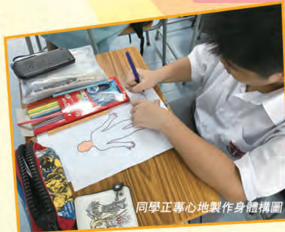
同學正專心地製作身體構圖