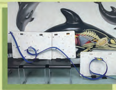
同學設計的過山車軌道