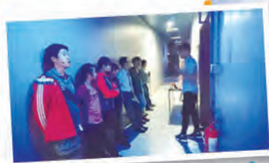
出賽前的最後準備