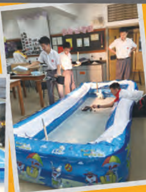
比賽前，測試自製的太陽能模型船