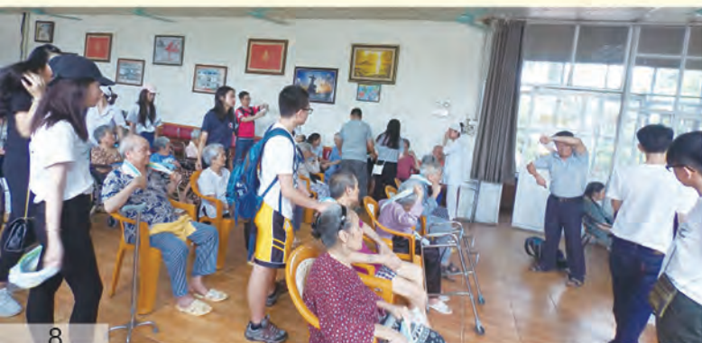
同學到越南老人院進行服務