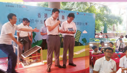
介紹太陽能車的設計

我校中四級物理班於 2017 年 7 月 7 日到太空館欣賞天象節目《夢幻極光》。《夢幻極光》利用縮時攝影捕捉極光的千姿百態，展現在太空館球幕之上，再配合電腦動畫清楚展示極光產生的機制，令同學親身感受極光及了解極光的由來。