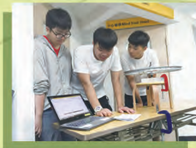
利用運動感應器測試圓周運動

我校中四級物理組同學於 2017 年 8 月 4 日參加由香港海洋公園學院舉辦的「動感物理」課程。在活動中，同學可利用先進儀器和學習工具，在遊樂景點中進行實驗，從而了解海洋公園機動遊戲的機械和物理原理。