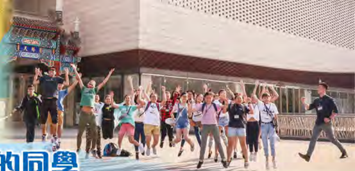
天橋藝術中心觀賞《冰上天鵝湖》 芭蕾舞表演