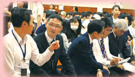
日本國駐香港總領事館（廣報文化部）的領事鯉田知史先（左二）