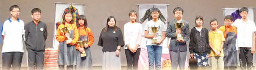
於青年廣場Y綜藝館舉行優勝者演出暨頒獎典禮