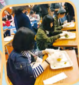
Skeleton Leaf making workshop ( Biology)