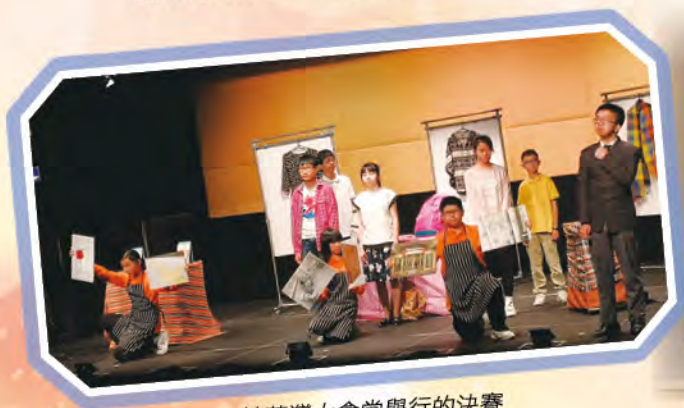
於荃灣大會堂舉行的決賽