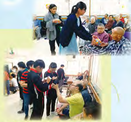
同學為長者們寫上心意卡