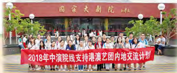
與一眾成員參觀國家大劇院

我同時相信一種文化的承傳和延續是需要年青一輩的加入，在參觀燕京八絕藝術館和河北雜技團後，我明白到中國很多傳統手藝等正面臨著失傳的問題，因為越來越少的年輕人加入。但是從與他們的交談中，我發現當地的政府和他們都一直致力推動傳統文化在社會在學校當中，希望不要流失。而回想香港，本土的小眾藝術，例如粵劇、手繪陶瓷等，也正面臨失傳的問題，所以我認為我們年輕一代在發展流行文化的同時，亦繼續傳承香港獨有的文化和藝術，甚至是一種精神！