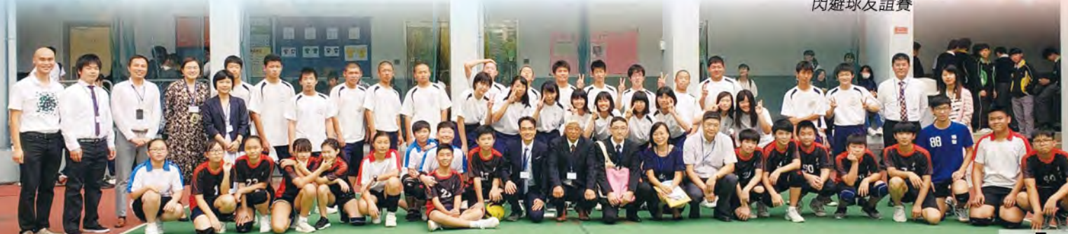
閃避球來一張大合照