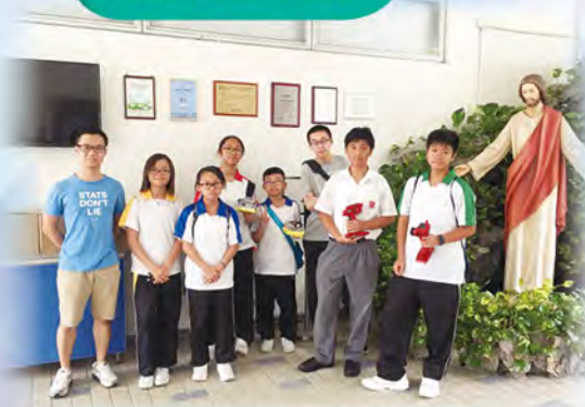
參賽同學與模型氣墊船合照