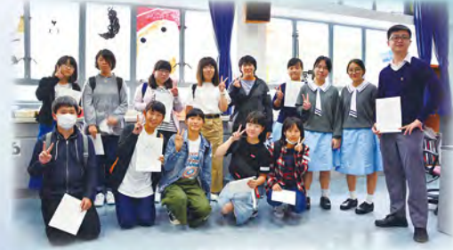
元朗天主教中學修讀日文的同學一同參與，上視藝課