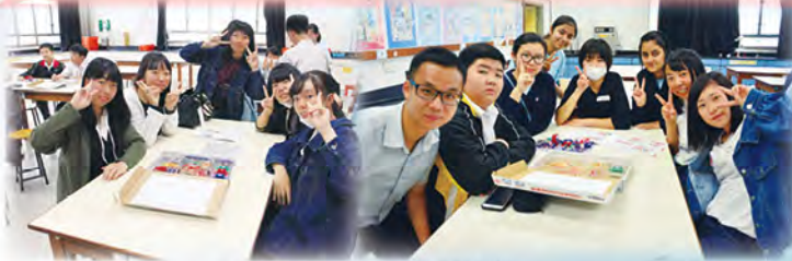
日本同學一同上STEM課