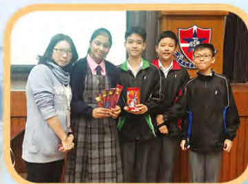
S1 English Quiz Competition– Champion 1D