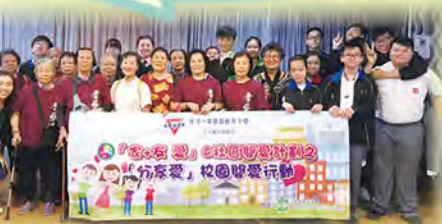
完成服務後與老友記影大合照

是次服務學習讓我知道我可以學懂如何籌備一個適合長者參與的活動。我在這次服務的最大得著是看到公公婆婆都很開心，令我很滿足。而是次服務我認為可以籌備時間長一點，讓所有部分都可以流暢一些。如果我是政府官員，我會落區聆聽他們的意見，收集他們認為這個社會應該改善的東西，我會盡量配合他們，給他們一個舒適的環境生活。