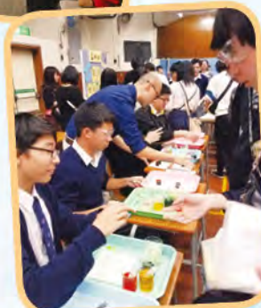
Molecular Gastronomy workshop (Chemistry)