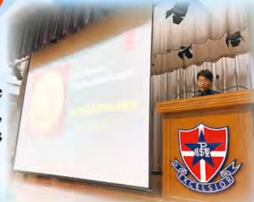
A sharing on famous Mathematician (Archimedes) in English

On 30 th November, nine game booths were provided for all students. They had lots of fun!