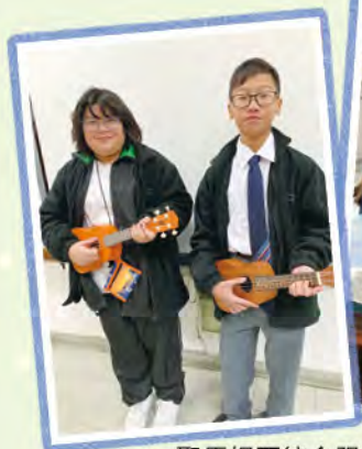
聖馬提亞綜合服務與小組成員見面