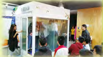
同學體驗大難淋頭活動