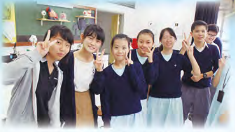
日本同學一同上生物課