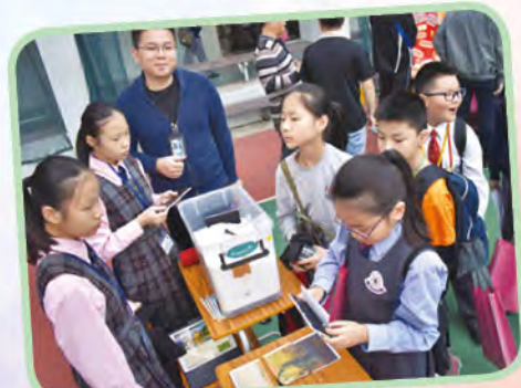
藝術發展組——拼出名畫