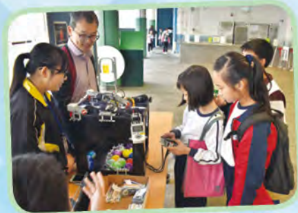
資訊科技科——LOGO 夾公仔機