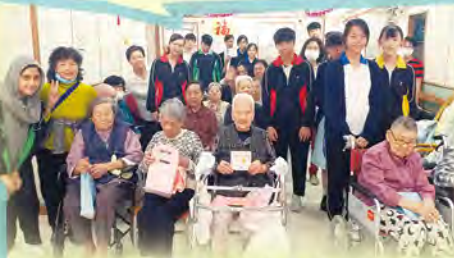
同學們送上心意卡

在這次服務學習中，我發現其實老人家的需要並不多，只需要別人簡簡單單的陪伴和溫暖，就能很開心。因此，如果我是政府官員，我會成立義工組，尋找更多身邊的有心人成為義工。定期去老人院探望他們，陪陪他們，就已經很足夠了。