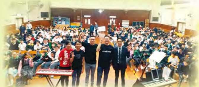
表演單位與全體同學大合照