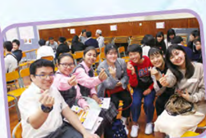
分享環節以食物作主題