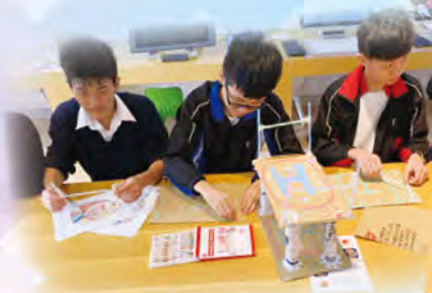
STEAM VR_We are making our own drone platform!