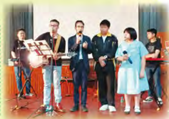
校長與同學亦上台與樂隊合唱