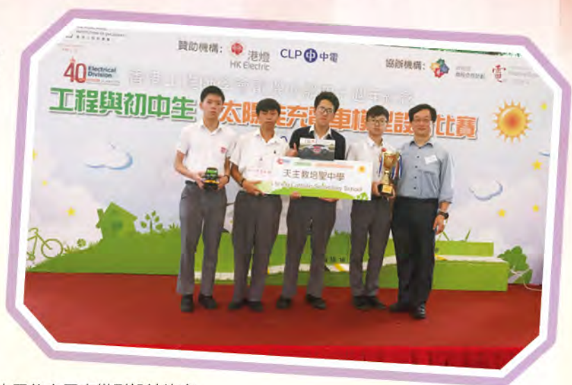
中三級：工程與初中生 - 太陽能充電車模型設計比賽