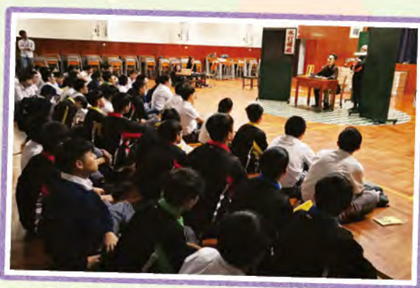
全無台詞的表演形式下，透過面具肢體語言說故事