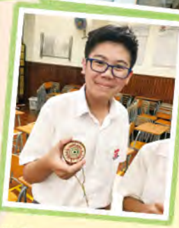
同學正在製作藝術品