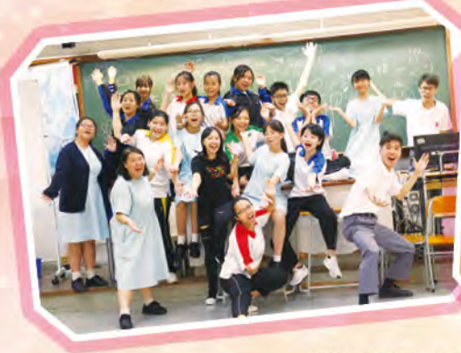
劇社成員於演出前合照