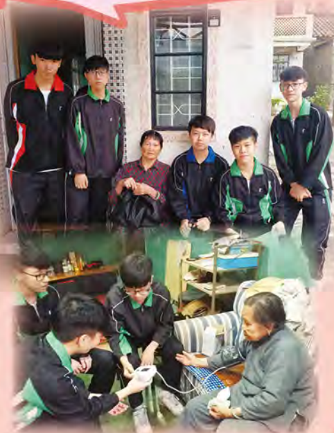
同學細心地為長者量升血壓

是次活動中我是負責送禮物給長者的。我認為自己的成功之處是我可以用最親切有禮的態度與長者相處，送禮物時會先稱呼老友記，再雙手奉上禮物交到長者手中，這樣做令長者感到受尊重，受人重視的感覺。從是次服務中，我體會到長者是需要同多些關心的。因為他們每天的生活都是差不多的，是很需要義工的陪伴，給他們多點快樂，令他們感受到更多來自社會的關愛。