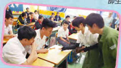
介紹日本文化課——日本同學介紹日本所用的硬幣