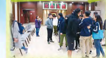
同學殯儀館的靈堂參觀

參加完這次生死教育營後，我感受到死亡是嚴肅、無助和孤獨的。這次宿營特別深刻的活動是在花園上看墓碑，當時我看到一塊墓碑，年紀只有二十九個月大的小朋友，他生前本來已經被家人拋棄，受盡病痛的折磨，死亡也要自己一個人面對。這事令我聯想到，如果死亡臨在我的身上，我希望我最愛的家人：爸爸、媽媽與妹妹，能陪我走完人生最後一段路。雖然我死後，我的家人會很想念我，但我也希望他們能陪我走到最後，讓我知道死亡不是一件孤單的事。