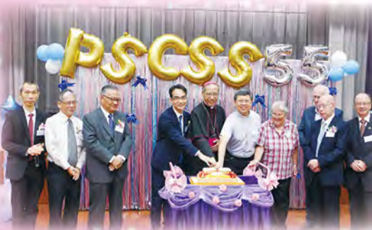
一眾嘉賓一同主持切餅禮，送上真誠的祝賀