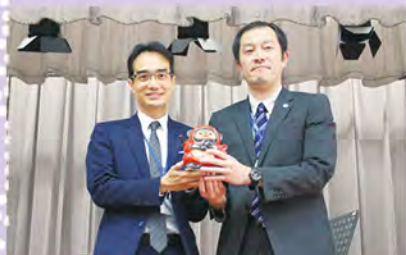
日方送贈滋賀縣名物燒陶福狸