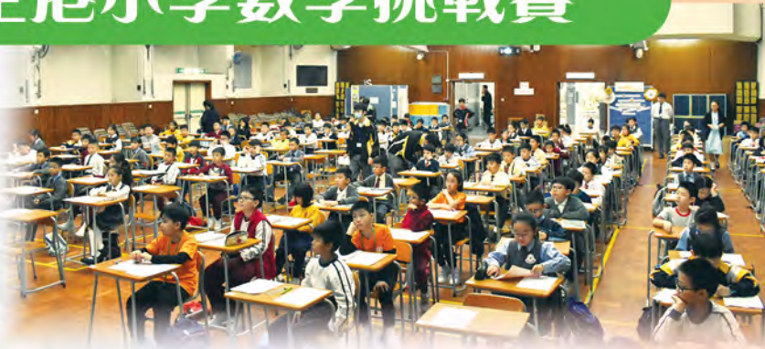
個人比賽——現場氣氛緊張

是項比賽由天主教教區數學聯會主辦、 我校協辦。初賽在2018年12月1日（星 期六）舉行，當日親臨我校參賽的學校共 有23間，參賽學生人數達555人。個人項 目及團體項目的比賽氣氛濃厚，參賽者 皆全力以赴，為爭取各項初賽獎項及決 賽出線權而努力。我校於當日亦安排了 不同科組的活動，供參賽者在小休時段 參與，讓參賽者放鬆一下緊張的心情， 繼而能有更佳表現。