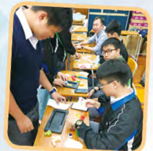
Maths game Booth– Puzzle Mystery