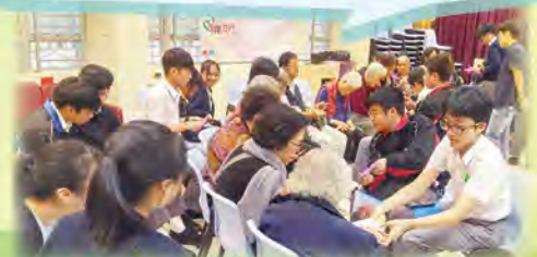
同學與長者一齊摺紙

是次活動是我第一次做活動的主持，我體會到團體間的合作是十分重要的。我在很多同學的支持和幫助下完成整個活動，過程中不是只有自己一人，而是整個團隊分工合作。完成這個活動後，我認為自己的改善之處是要更加有勇氣去發聲，還有做主持時要先重整自己要說的話。假如我是政府官員，我會親身去了解長者，而不是透過他人的反映才做出措施。