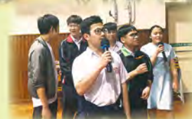
同學也很喜歡唱歌呢！