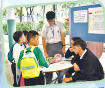
數學科——數學難題大挑戰