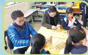
我校同學正在教導小朋友如何製作 VR 眼鏡