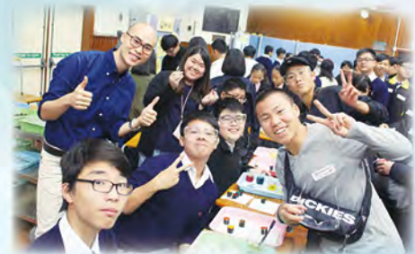
日本同學參與化學科分子料理攤位