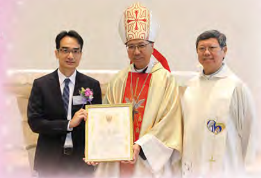
祈禱會上夏主教頒發教宗宗座降福狀

校史室祝聖禮後，隨即於學校禮堂進行切餅禮，為我校五十五周年送上祝福。最後更由在場嘉賓將幸運星放進印有五十五周年標誌的橫額中，橫額上印有不少過去五十五年來我校師生的校園生活照，而幸運星代表祝福，呼應了是次校慶的主題——「承傳五十五，邁向新世代」。是日活動在一片溫馨愉快的氣氛中圓滿完結。