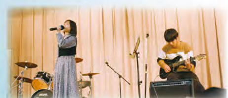
日方同學 Band Show