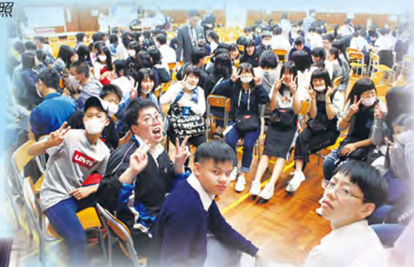
在禮堂分組分享交流時的盛況