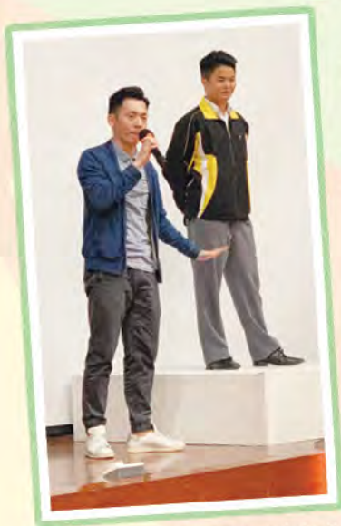
同學親身體驗及有機會踏上舞台

中五、六的同學於十一月在我校禮堂欣賞香港藝術節當代舞蹈平台教育計劃示範講座。他們親身體驗專業舞者的講解及示範，更有機會踏上舞台，體驗舞者怎樣利用表演空間創作，對甚麼是當代舞有更深刻的認識。