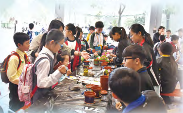
公民教育組——環保盆栽製作