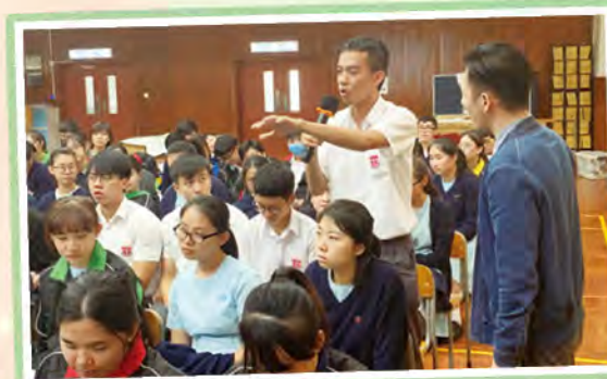
同學正嘗試評賞舞蹈