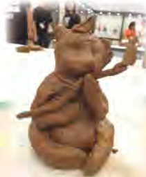
認識天津的泥人張是雕像