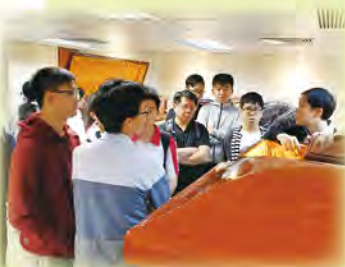
同學留心聆聽工作人員講解棺木