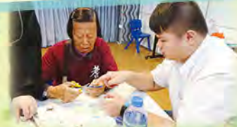
同學教導長者做手工

這次服務我的崗位本來是協助長者做手工，但中途發現我的同學做講解的時候表達得不夠清楚，於是我去幫助他們，令長者成功進行活動。是次活動令我發現自己缺乏耐性，因為當時我不明白有些長者所表達的是什麼，所以途中我選擇了放棄，很簡單地回答便算。我要提醒自己下次再做服務時，要有耐性去聆聽別人的說話。