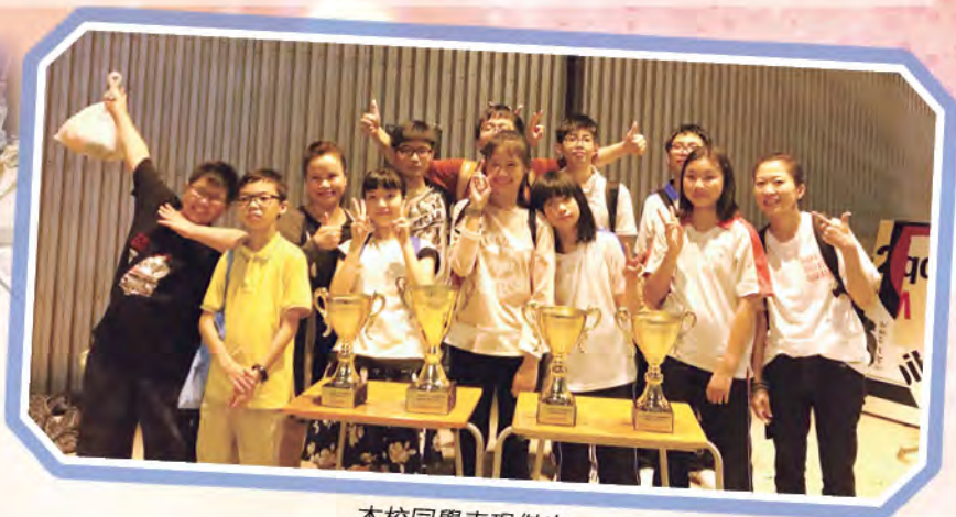
本校同學表現傑出