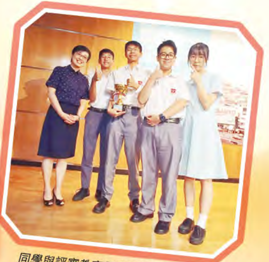
同學與評審教育局高級課程發展主任李淑賢女士合照