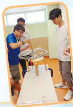
利用運動感應器 測試圓周運動

我校中四級物理組同學於2018年8月25日參加由香港海洋公園學院舉辦的「動感物理」課程。在活動中，同學可利用先進儀器和學習工具，在遊樂景點中進行實驗，從而解構海洋公園機動遊戲的機械和物理原理。