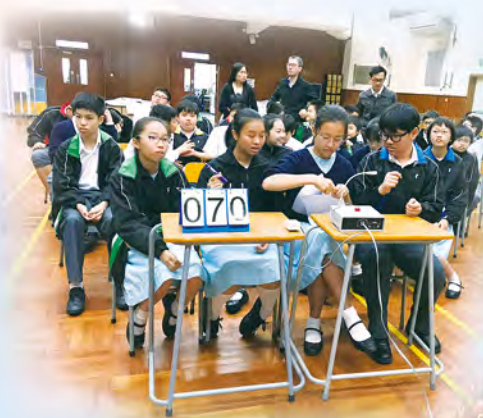
S1 English Quiz Competition