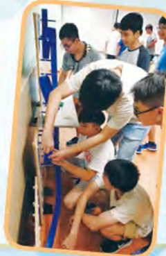
同學設計的 過山車軌道