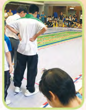
同學順利完成賽事