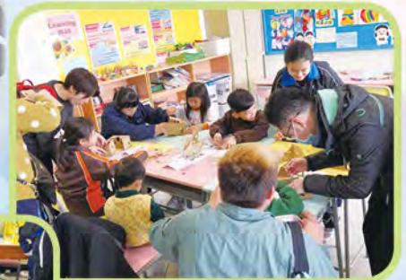
出席工作坊的家長及小朋友都樂在其中