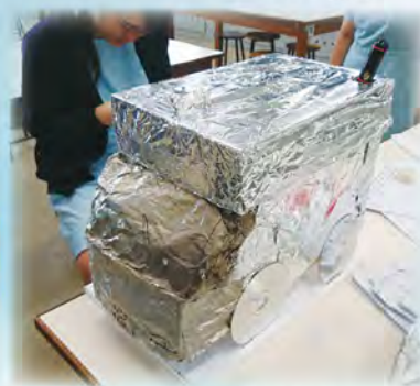
最佳工藝獎隊伍作品