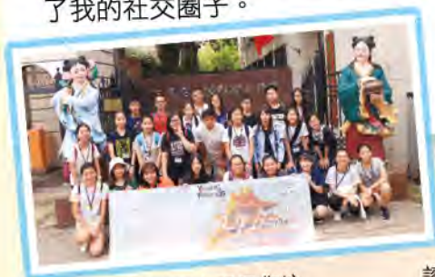
參觀泥人張工作坊

三個城市都有深厚的中國文化知識，如今人們以不同的方式保護著它們，讓它們得以流傳，並且讓我們有機會欣賞這些在香港不常見的藝術表達方式。藝術表達的方式有許多種，但大家的目的是同樣的，表達出自己的感受，自己的想法，並傳遞給人，讓人一起體會。我在這短短幾天的時間中見識到可能一生中都不會再碰到的事物，真的是次難忘的經歷，在交流團還認識到一堆的別校學生，擴闊了我的社交圈子。