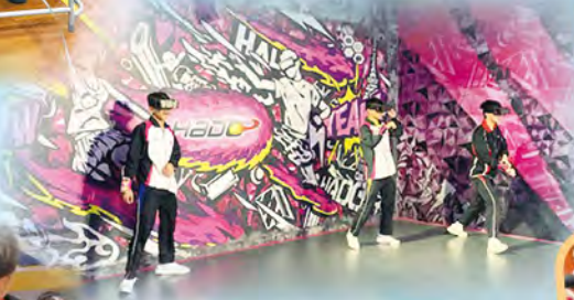
Dynamic VR Tasting