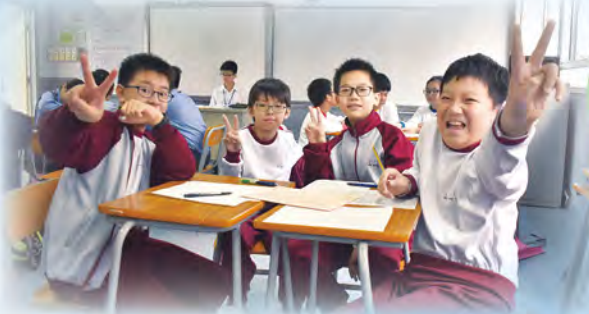
組別比賽——顯現參賽者之溝通及協作能力