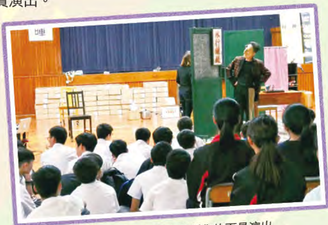
演員於劇中佩戴人手製作的面具演出

我校邀請得到香港賽馬會慈善信託基金及香港藝術發展局的贊助，參加香港藝「藝壇新勢力計劃」，邀請綠葉劇團為中四同學舉辦學校巡演及工作坊。在兩個小時的體驗裡，同學觀賞及試戴多款珍貴面具，親身認識《爸爸》的表演形式；並在演員帶領下分享感受，跳出框框從不同的角度欣賞演出。