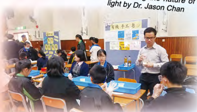
Hand made soap workshop (Intergrated Science)