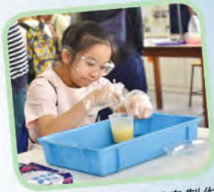
綜合科學科——手工皂製作