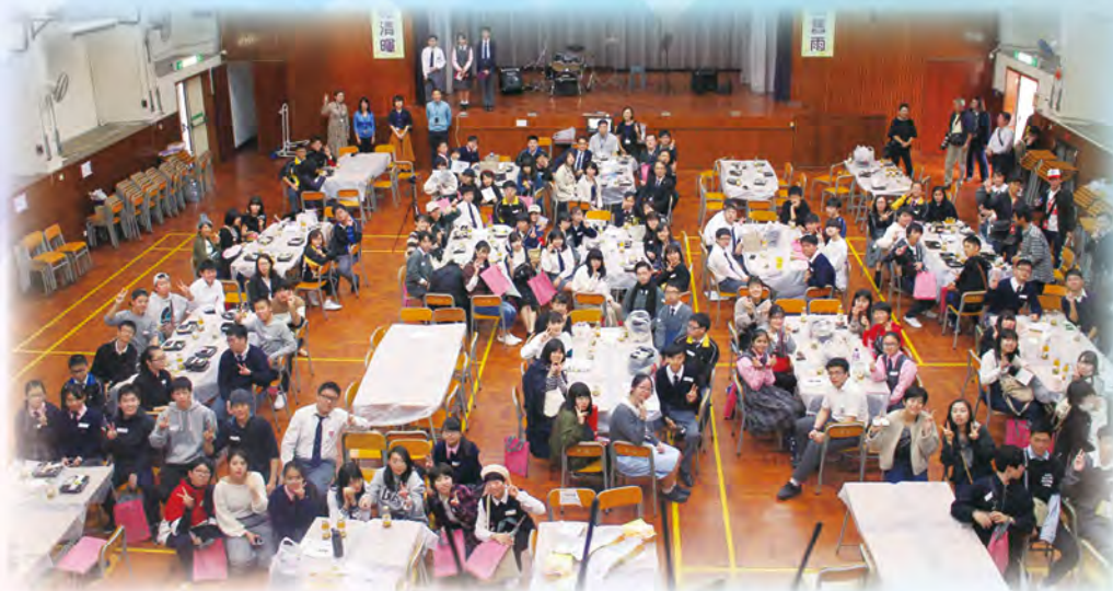
大家來一張大合照