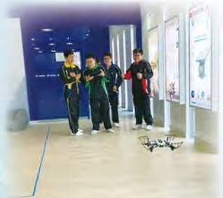
We learn to control a drone!