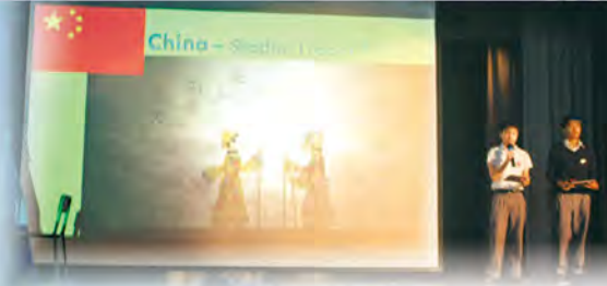
英語大使介紹木偶的種類