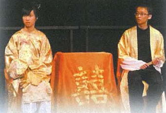
老爺和夫人為何如此憂愁？