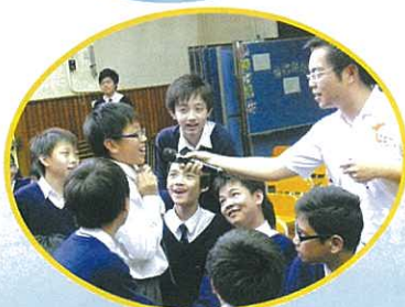
羅sir! 再來一條「外語題」吧! 我們不會怕的!

為讓同學多關心時事，了解國家發展和社會需要，輔導組、宗教、德育及公民教育組會辦「中一級時事常識問答比賽」及「中二級時事常識問答比賽」，已分別於2月20日及3月17日順利舉行。