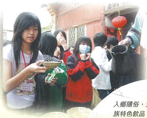
入鄉隨俗，先來一碗民族特色飲品！乾杯！

回憶這一次的六天貴州愛心之旅，令我獲益良多。令我感到最深刻的是少數民族的特色，在每個景點中，我都能夠看到不同少數民族在貴州的生活