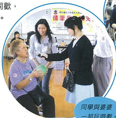
同學與婆婆一起玩遊戲。