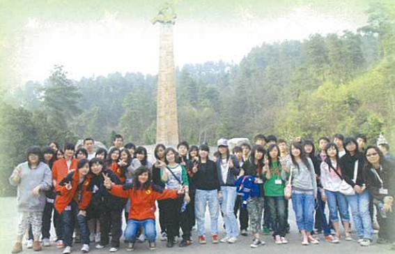
參觀遵義會址、息烽集中營和紅軍山

貴州旅程，讓我重新認識中國歷史，而這些歷史比書上的知識更深刻、感受更接近，如紅軍長征、貴州的文狀元趙以炳。而最大的得益，就是讓我明白世上有很多貧窮的人。他們可能是三餐不飽，沒有電視機，更沒有可能有玩具。所以我希望在此祝福他們，不要放棄，要相信「有志者事竟成」這個道理。