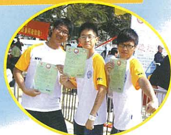
證書在手! 證明我們都游畢全程了!