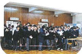
準備衝線？原來同學個個都想第一時間玩攤位遊戲！