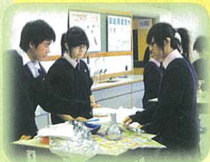
同學準備製作保溫瓶的材料。

本年度中四級物理科專題研習要求同學設計一個能把500 ml的熱水保溫的保溫瓶。冠、亞、季軍的組別均能將500 ml的熱水於1小時內保持只降4°C。得獎名單如下：