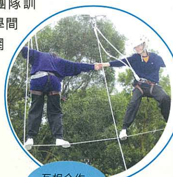
互相合作， 完成任務。

女生亦不比男生遜色，她們勇於嘗試，過了一關又一關。在班主任的鼓勵下，大部分同學都能完成任務。