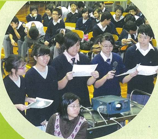
同心合力，齊齊把答案讀出來！