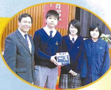
幾經辛苦，終於得獎了!