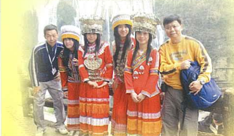
我們身後的黃果樹大瀑布多麼壯觀！