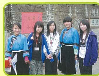
相請不如偶遇，與貴州少數民族姑娘來個合照。

回憶這一次的六天貴州愛心之旅，令我獲益良多。令我感到最深刻的是少數民族的特色，在每個景點中，我都能夠看到不同少數民族在貴州的生活