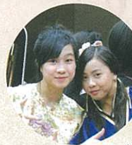
忙裡偷閒，同學在後台扮鬼扮馬。