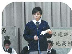
中文週怎少得「辯論」呢？看我們預科班的同學雄辯滔滔！有姿勢，有實際。