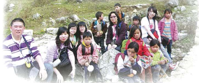
與山區學童走同一段路。