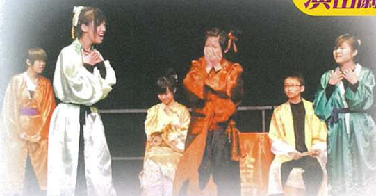
賓客口舌招尤，小翠施法作弄，賓客變得「有口難言」。