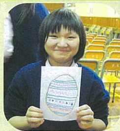
看我畫的復活蛋多可愛！