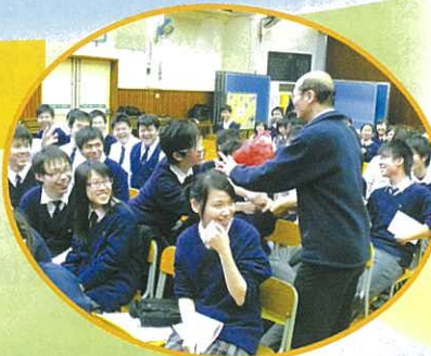
同學為老師送上小禮物! 氣氛融洽。

紅十字會於11月20日到校進行捐血活動，八位家長義工到場協助，表現家校合作的精神。全校共有104位師生捐血，他們無私奉獻的精神，實在值得表揚。