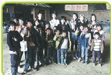
沒有漂亮的衣服，但可以有燦爛的笑容。

到黃果樹瀑布觀光也使我很難忘。那瀑布的流水聲是如此動聽。長長的瀑布川流不息，活像一個個新生命的誕生。那瀑布何其壯觀，真不愧為世界第四大瀑布之一，同時也讓我為中國能擁有如此美景而感到光榮。