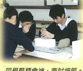
同學聚精會神，商討細節。