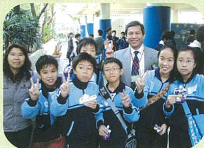
校長與小學隊伍合照，鼓勵他們努力參賽。

為提高區內學生對數學的興趣，本校於12月15日在該校禮堂舉辦「元朗區小學數學挑戰賽」，吸引區內二十多間小學參加。比賽當日氣氛激烈，各校成績即場顯示，得分亦非常接近，所有參賽學生均盡展所能，投入作賽，體驗及分享研習數學的樂趣。經過一番角逐，冠軍由光明學校奪得、亞軍則為光明英來學校、香港學生輔助會小學則取得季軍。賽後由教育局課程發展主任（數學）陳秀騰先生頒獎。比賽在熱鬧而愉快的氣氛中圓滿結束。