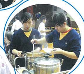
3E班同學盡心盡力，為長者準備湯水。