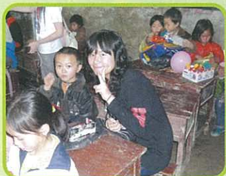
在簡陋的課室中也可分享學習的樂趣。

我這次感受到什麼叫做真正的窮困。原來貴州的貧富懸殊非常明顯，當我看見貴州鄉郊地方的窮困，生活環境不理想時，我才明白原來自己真的非常幸福。貴州