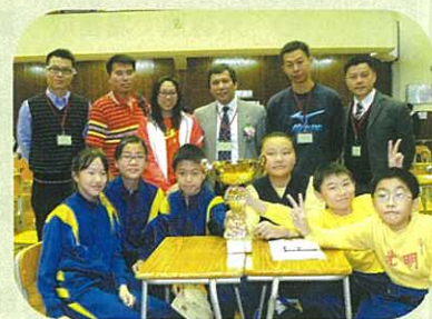
我校老師與優勝隊伍合照。