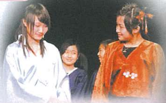
元豐和小翠初次見面。