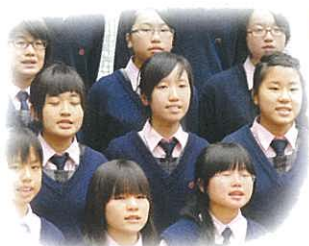
同學異口同聲，盡力把誦材的神髓表現出來。