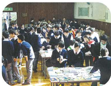
難得有大型書展，同學都來湊湊熱鬧。