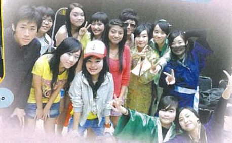
演出後，同學向觀眾分享苦與樂。