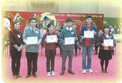
用心向學，現在得到別人欣賞肯定。