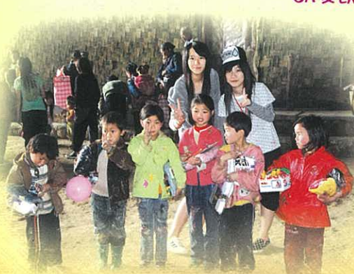
「……當我攀過一座山之後，又見到另一座山，山路好像沒完沒了……」

我們的生活環境好、交通設施完善，上班上學都不用走路，我們卻沒有好好珍惜，還要埋怨。看到山區生活的人民，不禁有些慚愧。