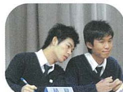
組員忙於商討對策，看我們怎樣「以理服人」！