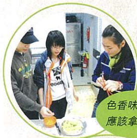
色香味俱全！ 應該拿滿分！

導師透過不同類型的活動，培養及提升同學的領袖才能、團隊合作精神及解決疑難等各方面的能力，務求令學生得到全面的發展。