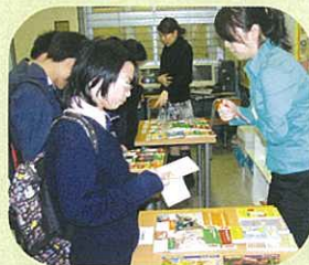
同學在英語角參觀圖書。