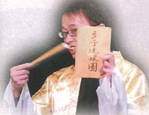
「多子連環圖」？老爺為王家繼後無人的事想盡辦法。