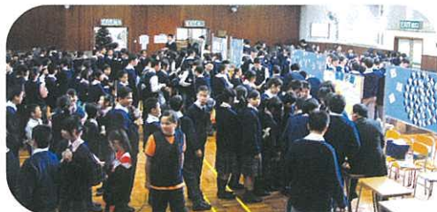
禮堂設優秀作品展示區、攤位遊戲區及書展，難怪這裡萬人空巷，擠得水洩不通了！