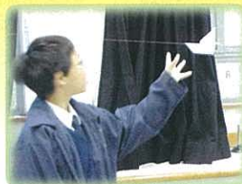
看！我的設計能走多遠！

本年度中一及中二級綜合科學科解難活動的題目是「程牽一線」。同學須設計和製造一輛以橡皮筋或由橡皮氣球排出的空氣為動力或制動力的裝置，而該裝置能在拉直鋼線上行走。