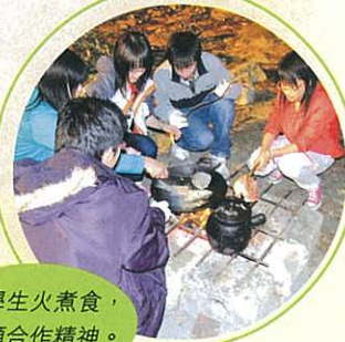
同學生火煮食， 盡顯合作精神。