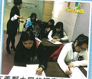
在善鄰大學的課室裏，學生正在認真地練習書寫韓文。