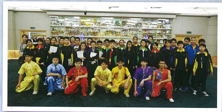
同學和澳門中學武術隊合照