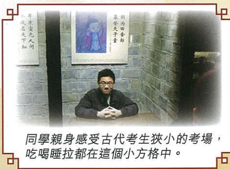
同學親身感受古代考生狹小的考場， 吃喝睡拉都在這個小方格中。