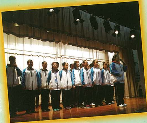
武漢同學表演詩歌朗誦

多年來，本校一直不遺餘力地推動中港兩地交流，期望透過同學與中國內地青少年學生之間的文化交流與合作，促進兩地學生互動、增進友誼及共同成長。