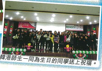
韓港師生一同為生日的同學送上祝福。