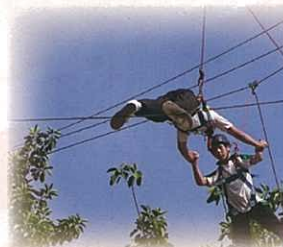
旅程前歷奇訓練 —— 同挑戰自我，互相支持