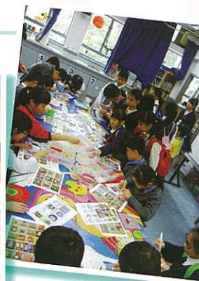
休息時段（參與視藝科活動）