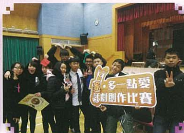
學生分享得獎喜悅