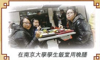
在南京大學學生飯堂用晚膳