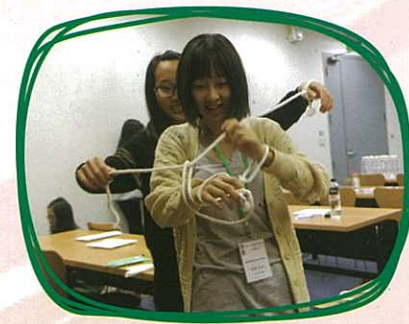
得勝者協會 —— 在解繩子的活動中，同學需要不斷嘗試才能成功解開。