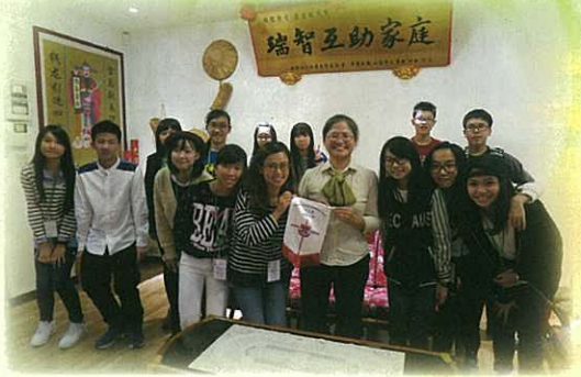
失智者協會——我們認識了長輩的生活，及家人互助的重要。