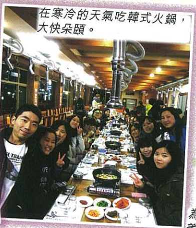
在寒冷的天氣吃韓式火鍋，大快朵頤。