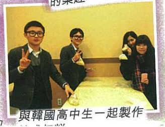
與韓國高中生一起製作