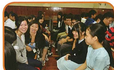
本校同學與日本同學交流