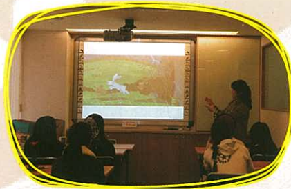
三之三文教出版 —— 葛女士為同學介紹有義意的生命繪本