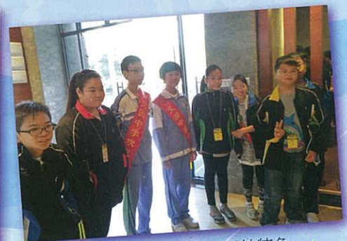
珠海中學同學介紹學校特色