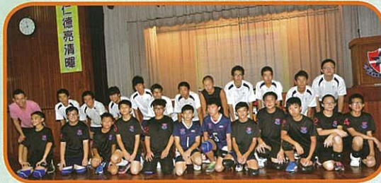
兩校閃避球隊合照