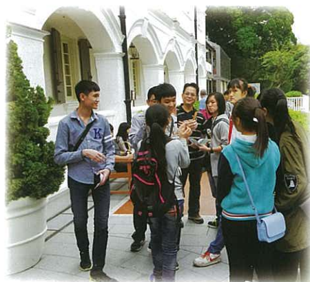
師生們帶著興高采烈的心情 等待進入文物酒店參觀