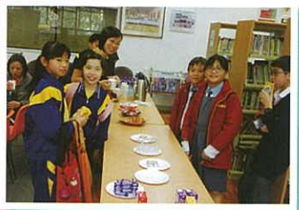
休息時段（圖書館活動）