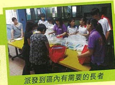
派發到區內有需要的長者