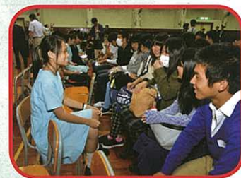
本校同學與日本同學互相認識