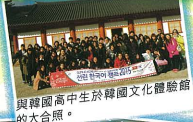
與韓國高中生於韓國文化體驗館的大合照。