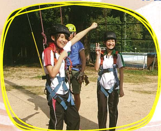
旅程前歷奇訓練 —— YEAH! 我做到了!

在這次台灣感恩生命節之旅我領悟到不少人生的道理，正確價值觀，每參觀一個機構，認識一處地方，我都有深刻印象，其中有幾個印像較為深刻而且有較大的領悟。