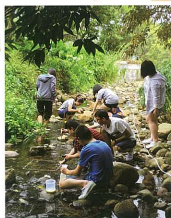
學生在淡水溪流進行考察工作

本校為高中生物選修的同學舉辦野外考察學習營，同學需到大嶼山梅窩的淡水溪流進行一連串考察工作，在為期三日兩夜的學習營中，同學除可體驗考察工作外，更學習使用不同量度儀器之技巧。獲得初步數據後，同學更需設計實驗以研究生境中不同生物間或生物與環境間的關係。期望同學完成此次學習營後，對生態學有更進一步的了解。