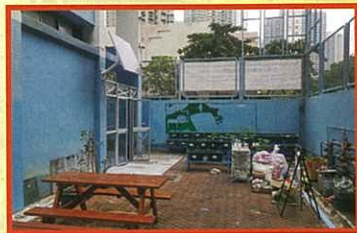
種植區及溫室外美化前情況