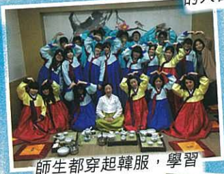
師生都穿起韓服，學習韓國茶道文化。