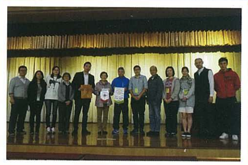
教師與澳門學校代表留影