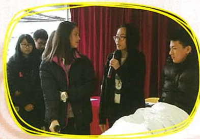
匯報 —— 同學以話劇形式向區內人士匯報大體老師的故事