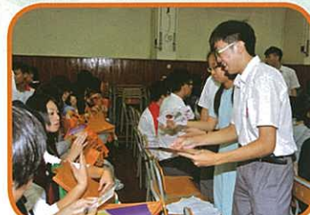
本校同學致送親手製作的書籤