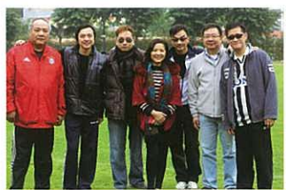
校友特意來到運動場親身支持各健兒

陸運會隨著各嘉賓、校友及在場同學的一片熱烈掌聲中圓滿結束，期望各健兒明年繼續努力，再創佳績！