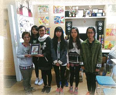
孫媽媽工作坊——學生代表致送紀念品