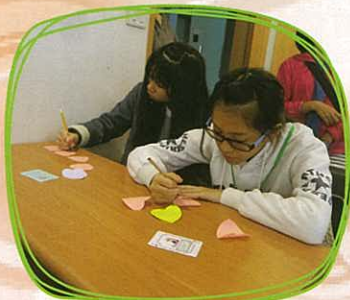
三之三文教出版 —— 同學把自己對他人的欣賞寫得滿滿的