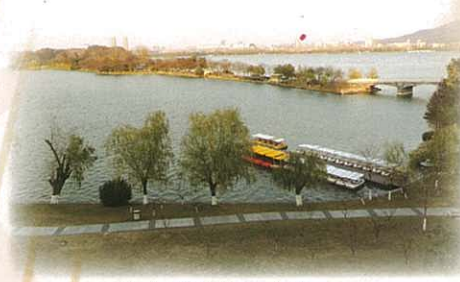
波光粼粼的玄武湖