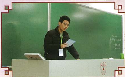
郭同學代表本校分享對旅程的感悟