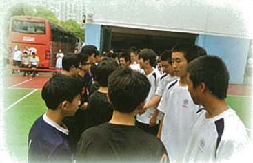
閃避球隊成員與日本高校同學進行友誼賽