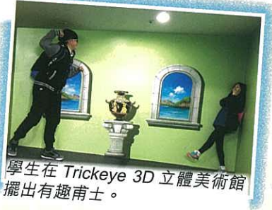
學生在 Trickeye 3D 立體美術館擺出有趣甫士。

由香港天主教教區學校聯會（中學組）主辦的韓國善鄰大學遊學團於二零一五年十二月十九日至十二月二十四日舉辦了六天的遊學活動。