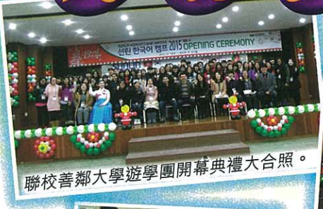
聯校善鄰大學遊學團開幕典禮大合照。