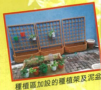
種植區加設的種植架及泥盆