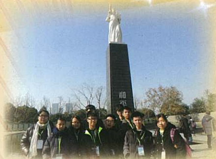
紀念館的主題——對世界和平的寄望