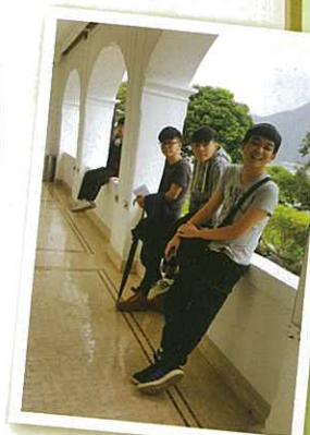
參觀大澳文物酒店