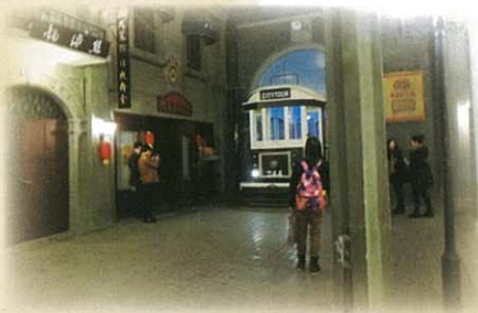
南京博物院中的民國館， 重現民國時期的街景。