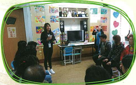
孫媽媽工作坊——林同學向工作坊的學員及社工介紹本校及是次交流活動。