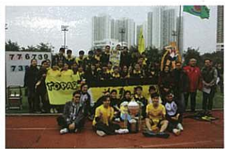
善舍奪得全場總冠軍，捧走「冠軍盃」