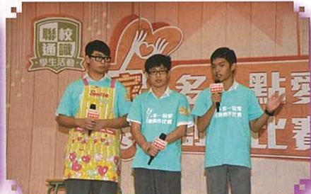
初賽同學回應評判提問。