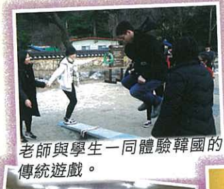
老師與學生一同體驗韓國的傳統遊戲。