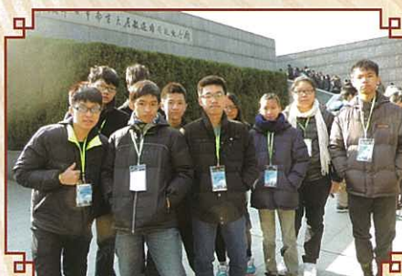
參觀南京大屠殺遇難同胞紀念館