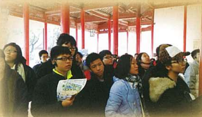
同學在總統府內細心聆聽導賞員講解