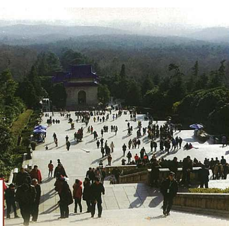
中山陵的 392 級樓梯