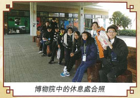
博物院中的休息處合照

行程的第三天，通過在南京總統府的遊歷，我們能一窺民國政府辦公的所在地，感受中西文化融合的建築風格，也同時了解兩江總督及大平天國的歷史資料。我們又到南京博物院遊覽，在偌大的展館中參觀珍貴的展品，在極具民國建築風格的民國館中間逛。晚上，我們到南京的母親河——十里秦淮遊覽，順道到訪位於河畔的江南貢院，了解古代科舉制度的歷史。當晚，我們夜遊秦淮兩岸，感受「煙籠寒水月籠沙」之美，亦能品嚐兩岸的特色食品，漫遊熱鬧的商鋪中，購買當地特產作手信，同學都滿載而歸。