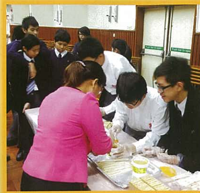
sen組同學準備了不同小食予嘉賓

因此，本校於12月15日接待武漢光谷實驗中學交流團，師生共112位人員。活動除了校園參觀之外，並得到體育科、SEN組、數學科及中文科各老師支持，安排了各式攤位遊戲及活動，讓兩地師生同樂。期望上述學生交流活動，能啟動武漢與香港在學術交流開展合作，並期望將來能夠取得豐碩成果。