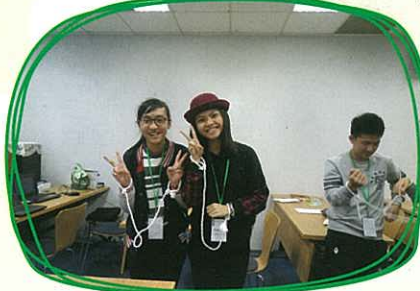
得勝者協會——看！我終於把這個結解開了！