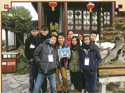
在秀麗的瞻園中與友校 同學及導遊合照