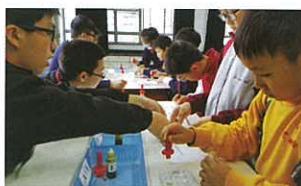
休息時段（參與化學科活動）