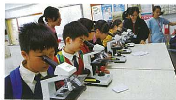
休息時段（參與綜合科學科活動）