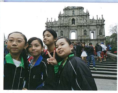
同學們在大三巴前影個不亦樂乎