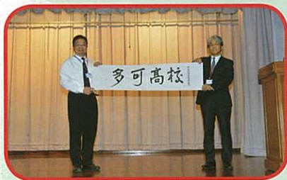
日本高校致送紀念品予本校