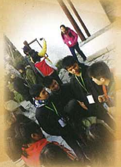
在瞻園與導遊交流