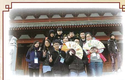
靖海寺的大殿前扮鬼扮馬

行程的第二天，同學到位於紫金山的明孝陵及中山陵遊覽，前者是封建王朝開國皇帝朱元璋的陵寢；後者是中華民國總統的安息之地，兩者的歷史與建築風格迥然不同，同學透過導遊的講解及親身的觀察，思考建築風格所反映的文化意義。傍晚時份，我們登上明朝的古城牆，認識歷代城牆的建築特色和對防衛國家的意義。我們足踏古城牆之上，沉醉在夕陽餘暉之中，遠眺波光粼粼的玄武湖，在開闊的天地中發思古之幽情，真是別具意義。