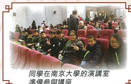
同學在南京大學的演講室準備參與講座