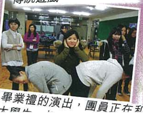
為了畢業禮的演出，團員正在和