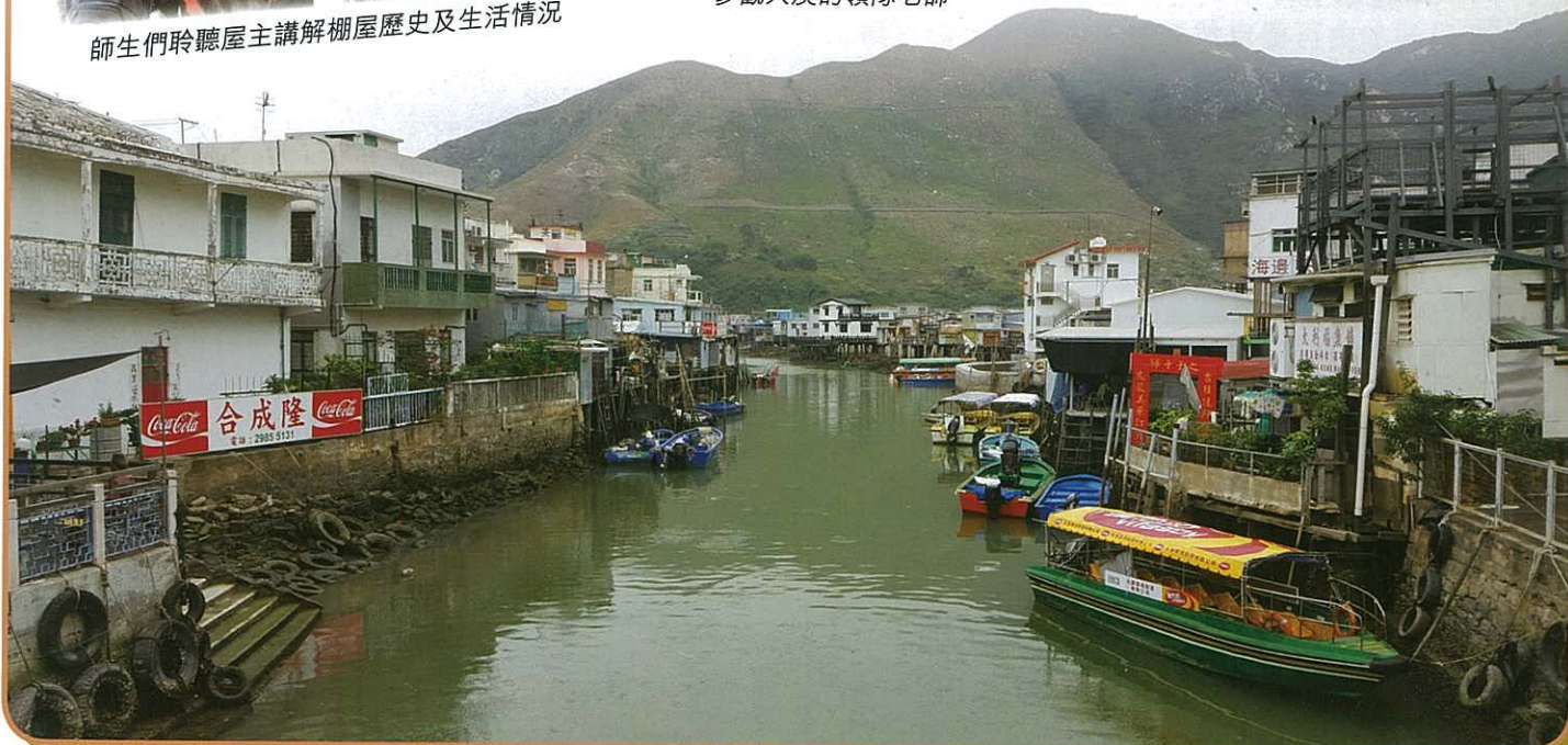
大澳水鄉風光盡入眼簾