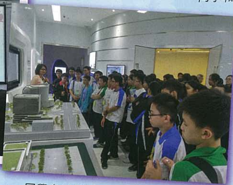
同學參觀橫琴企業，了解當地發展