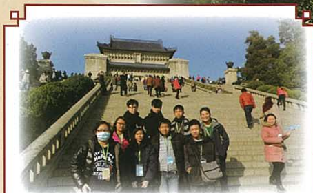
中山陵的台階上，與導遊合照