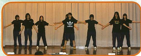
日本高校同學的舞蹈表演