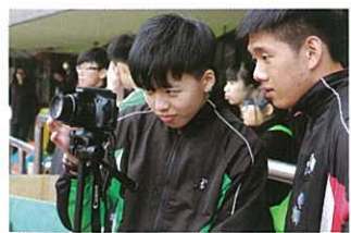
小記者在場內捕捉每個精彩畫面