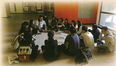
輔仁大學醫學系 —— 同學分享自己對大體老師的感受及自己對生命及死亡的看法