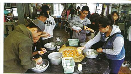
大夥兒興致勃勃學習製作鹹蛋