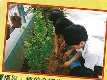
種植區，種植多樣化的植物的情況