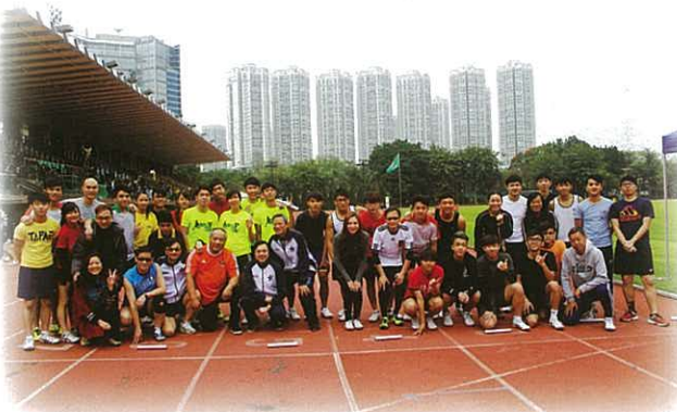
師生接力賽是每年陸運會的全場焦點