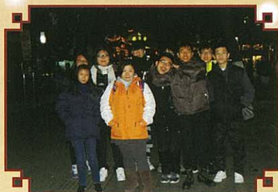
秦淮河兩岸的購物街留影