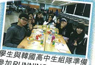
學生與韓國高中生組隊準備參加RUNNING MAN活動。