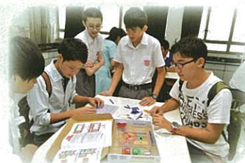
日本同學參與綜合科學科