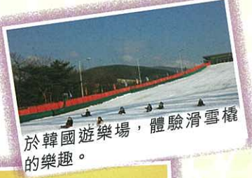
於韓國遊樂場，體驗滑雪橇的樂趣。