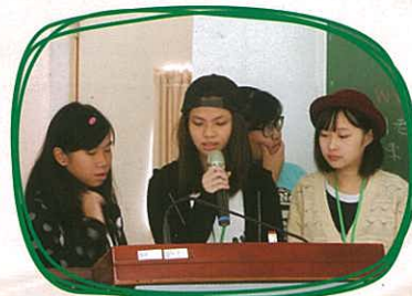
台北護理大學 —— 參觀每個機構時，同學也需介紹我們的學校及是次活動目的。