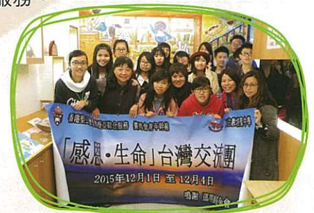
三之三文教出版 —— 感謝葛女士為我們介紹了繪本的世界。