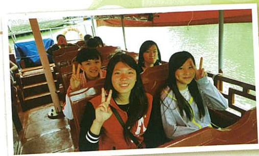
乘船細味大澳水鄉景色

回到大澳市集，又是同學大顯身手時刻：有埋首貨攤揀選手信的，有狂啖海鮮串燒的，更有一口氣買多個糯米磁、茶果拿回家孝敬家人的……他們都笑稱：今番可謂滿載而歸矣！