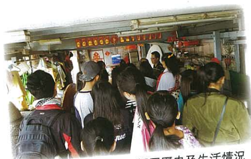
師生們聆聽屋主講解棚屋歷史及生活情況