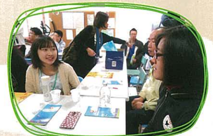
孫媽媽工作坊——同學和精神復康人士交流，過程融洽。