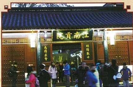
秦淮河畔的江南貢院，多少考生寒窗苦讀，為的是榜上有名。