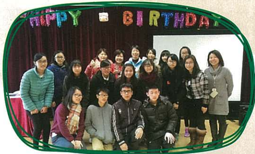
同學獲得聖馬提亞綜合服務義工嘉許狀