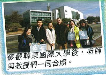
參觀韓東國際大學後，老師與教授們一同合照。