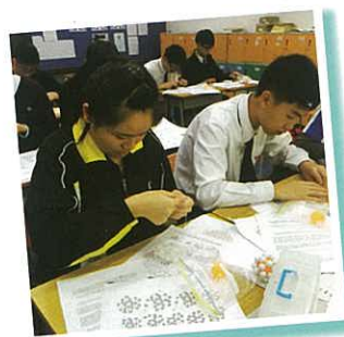
同學利用圓珠串出立體

香港教育學院教授張家麟博士受邀到本校舉辦立體幾何工作坊，張教授利用不同教具，引導學生如何用平面圖形製作出不同形狀的立體模型，再以柏拉圖立體為起點，利用串珠製作一個能完整包裹乒乓球的多面體模型。張教授鼓勵學生動手參與，並在活動過程中解釋所牽涉的數學原理，由淺入深地引領學生感受存在於生活上的數學，並從活動中愉快學習。