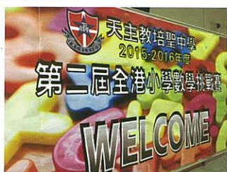
全港小學數學挑戰賽