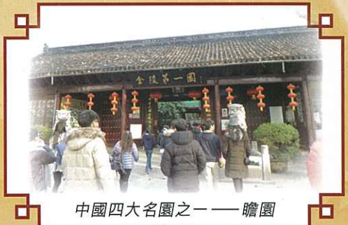
中國四大名園之一——瞻園

能親身感受古都的歷史韻味，在歷史名城中留下足印，想必為同學的學習歷程及成長道路之上留下美好的印記。