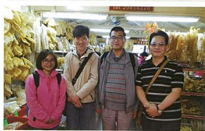
參觀大澳的領隊老師