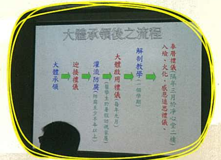
輔仁大學醫學系——教授向同學介紹大體老師計劃