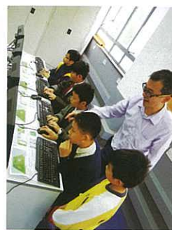
休息時段（參與電腦科活動）

第二屆全港小學數學挑戰賽由天主教教區數學聯會主辦，本校協辦。初賽在2015年12月5日（星期六）舉行，當日親臨本校參賽的學校共有23間，參賽學生人數達438人，為歷年之冠。個人項目及團體項目的比賽氣氛濃厚，參賽者皆全力以赴，為爭取各項初賽獎項及決賽出線權而努力。本校於當日亦安排了不同科組的活動，供參賽者在小休時段參與，讓同學放鬆一下緊張的心情，繼而能有更佳表現。