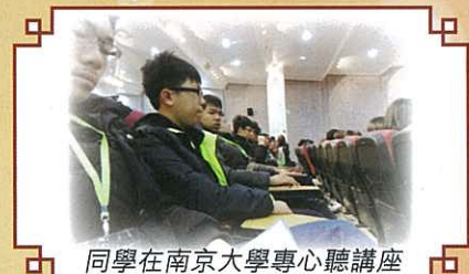
同學在南京大學專心聽講座