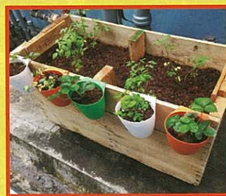
學生自行製作的種植箱