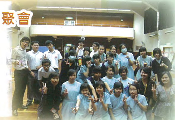
hi!我們是天主教同學會!

天主教同學會於2010年10月6日舉行迎新聚會，當日共有30多位同學參加，主席除了與會員一同進行多項破冰遊戲外，也為同學介紹本年度天主教同學會的活動，包括有玫瑰月祈禱會、訪問神父、義工服務、終生有計義工訓練等，最後我們更詠唱「感謝主」作為活動的結束。