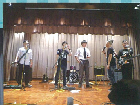
同學也有份參與，與表演者同台演出