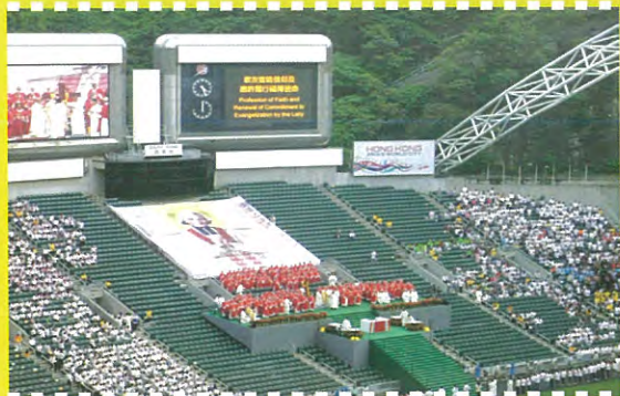
各司鐸神父再一次的為自己的聖職許諾。

十月十七日為天主教香港教區一年一度的傳教節，假香港大球場舉行。本校宗教組的老師陪同天主教同學會及慕道班的同學一同出席。今年主題為「司鐸的召叫·教友的福傳」。本年度教區傳教節希望透過活動訊息，引發同學聆聽、熱愛、依靠並活出聖言，在生活不同崗位上向天主的召叫作回應。今次傳教節活動其中一個特別的地方，是藉著傳教節讓各司鐸神父再一次的為自己的聖職許諾。我們實在希望透過今次的活動，使同學對天主教有更深入的认识，並了解到自己同樣擁有傳播福音的使命。