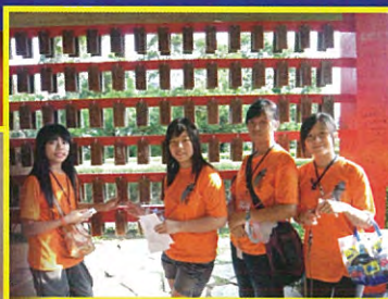
見證殖民地文化 - 紅毛城