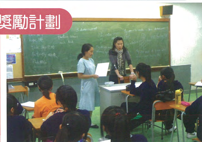
由我來向大家報告學習成果吧！

本校於今年度獲選為「寰宇希望·花旗集團成功在望獎勵計劃—學校伙伴計劃2010(表演與藝術)」之伙伴學校。是次活動之對象為中四及中五同學。參加者需跟隨設計師以「環保」為大主題設計一件時裝，由模特兒於12/5週會時裝秀中展示。活動除可增加同學對藝術範疇的認識外，更能培養同學的正面思考、認識時裝設計的英文用語及提高同學解決問題的能力。