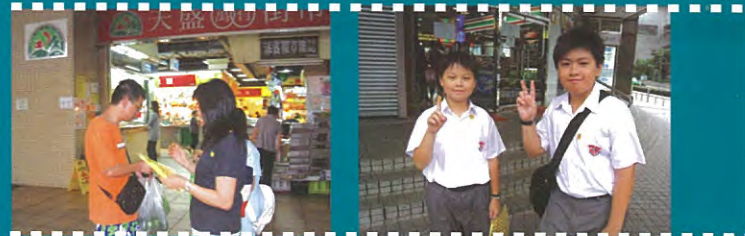
家長熱心參與賣旗