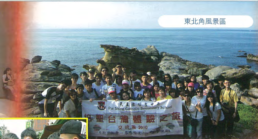
天主教培聖中學 Pui Shing Catholic Secondary School 培聖台灣體驗之旅 交流團 2010 日期：十一月一日至十一月四日