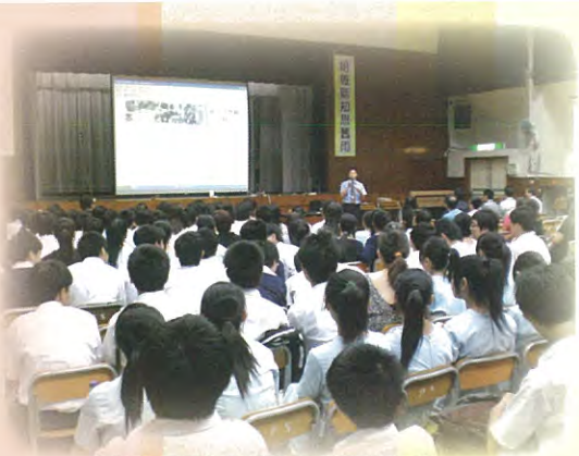
學與家長留心聆聽各科入學的要求。