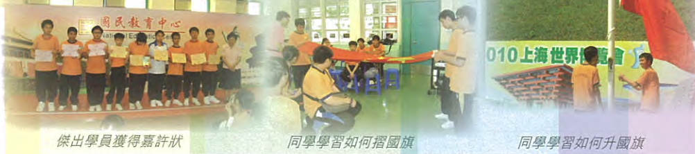
傑出學員獲得嘉許狀

日營完結前，學生需反思所學當天所見所學，最後更參加了簡單而隆重的嘉許儀式，傑出隊長及學員更獲頒發獎狀以示鼓勵。