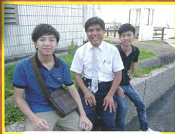
同學與司機先生合照多