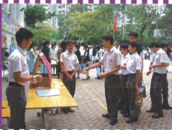
這個攤位遊戲是否很易玩呢？