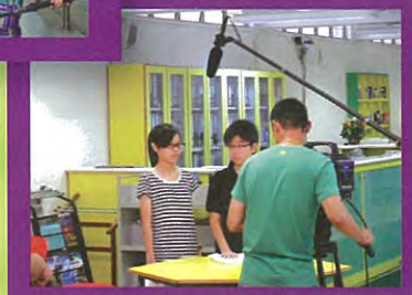
本校同學在短片中粉墨登場。