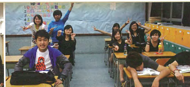
時光倒流，回到以前的班房，重溫校園生活點滴。