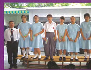
《問問Master Joe》有獎問答遊戲得獎者留影。