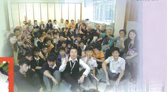
3C同學與長者大合照