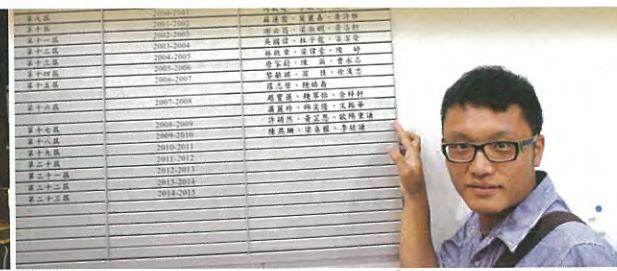
你看！我榜上有名呢！