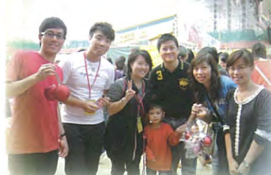
老師們也到場為同學打氣和幫助叫賣