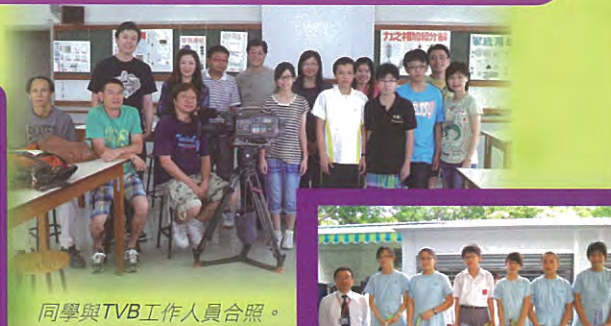
同學與TVB工作人員合照。