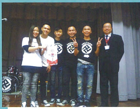
表演過後，拍照留念。

為擴闊高中同學對音樂的認識及支持本港青少年創作，本組特意邀請「天比高創作伙伴——賽馬會策動創新思維」到校舉行「冲天校園」表演。表演嘉賓「RedNoon」樂隊期望此活動能藉著音樂把積極人生、永不放棄及向理想邁步奮鬥的信念帶給每位同學，期望藉此燃燒起同學心中的鬥志。