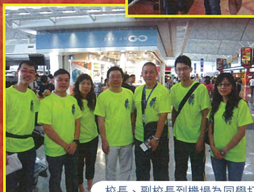
校長、副校長到機場為同學打氣