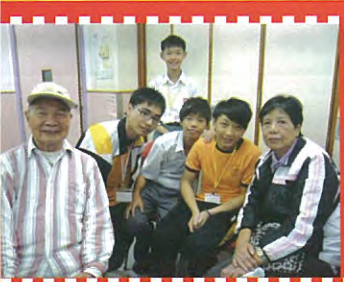
3C同學與長者一起拍照

中三級《培聖起義》服務學習課於2010年10月6日正式開展，是次活動我們與仁濟醫院第廿四屆董事局社會服務中心合辦，希望透過四節的義工訓練及一次出外探訪老人院的活動，讓同學超越自己，發揮潛能，藉此感謝長者對社會作出的貢獻，同時實踐天主愛德的精神。