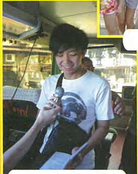
同學在遊學期間， 每天也不忘早禱