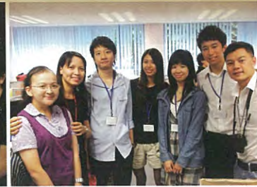
校友參觀新教員室。