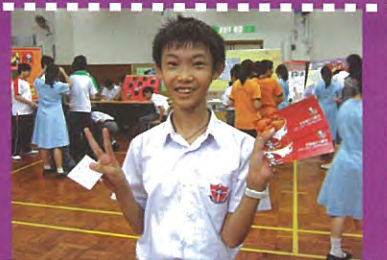
我換取了豐富的獎品