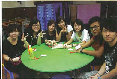
Hi! 我們是07年的畢業生!