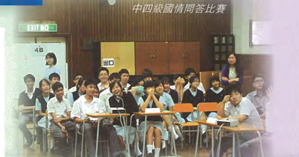
中四級國情問答比賽

為加深學生對祖國的認識，公民教育組於10月4-8日舉辦國慶周。國慶周期間，本組公民大使特為初中同學設計與中國國情相關的攤位遊戲；此外，公民大使於早會與學生分享國情，讓學生對當代中國發展概況有進一步的了解。與此同時，本校禮堂亦設有國家概況展架及午間電影欣賞供學生觀賞。學科層面方面，本組分別與歷史科、視覺藝術科、通識科及中史合作，舉辦了不同類型的比賽如問答比賽，讓學生從參與中加強對中國國情的認識。