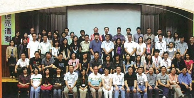
陣容鼎盛的培聖大家庭。

10月17日的校友日暨47周年校慶活動已圓滿結束。本年度的校友日活動多姿多彩，除了晚上的聚餐外，午間還舉行「以歌會友」和「以波會友」的活動，讓一眾志同道合的校友能藉樂隊合奏及球類活動彼此交流、互相切磋。不少校友亦相約一起回校，探望恩師之餘，亦回味昔日的校園生活，同時見證培聖的發展與改變。