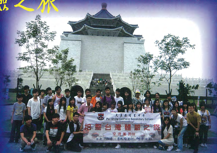
中正紀念堂前大合照

參加同學更於11月11日在週會時段為中四五同學分享他們在台灣所見所聞和研究報告，報告題目包括《台灣殖民地文化及生活》、《台灣飲食文化》、《台灣生態保育》及《台灣文化特色》。