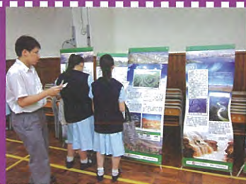
學生用心觀看展架的內容