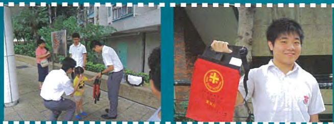
小妹妹也充滿愛心。