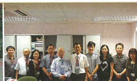
前輩！來個大合照吧！