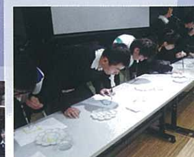
模擬傷殘的人，讓同學學習到不少人生命或有缺憾，但是仍努力把握現在，希望同學可以活好每一天