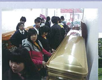
同學近距離接觸棺材