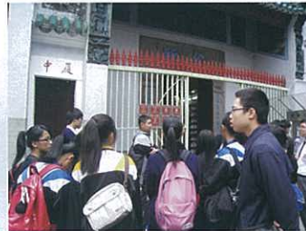
同學到上環文武廟認識開埠時香港人的死亡觀

活動後，我對死亡的看法知道了更多，死亡並不是可怕的东西，其實人人都要經歷。因此，我們不應該懼怕死亡，反而，每一個人更應活在當下，享受生活的每一刻，關心家人和朋友，這樣生活才精彩。