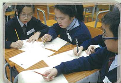
乙部比賽情況：參賽學生聚精會神，盡展所能。