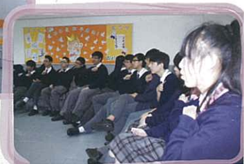
同學們正在努力學習聾人常用手語。