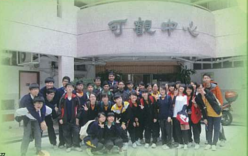
於可觀自然教育中心門前大合照