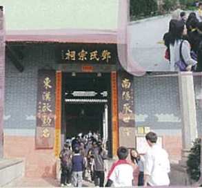
學生正在參觀本港最大的祠堂——鄧氏宗祠