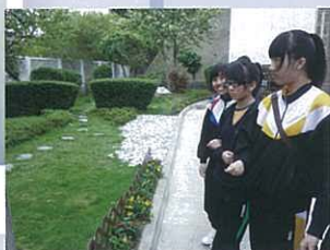
現在不少人也選擇在死後將骨灰撒在骨灰公園，這與現代人的死亡觀改變有關。