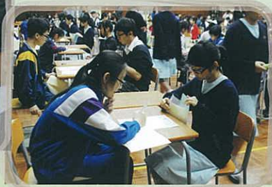
甲部比賽情況——參賽學生聚精會神，分析題目。