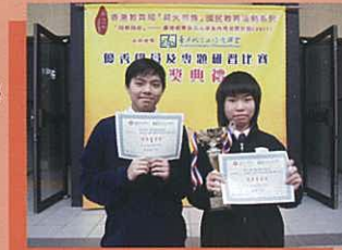
獲得優秀學員的同學表現雀躍