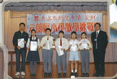
亞軍：天水圍天主教小學