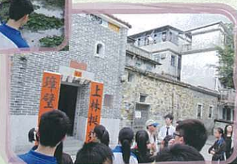
導賞員正講解上璋圍的建築特色