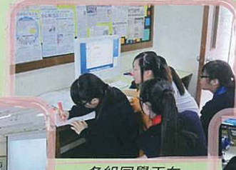
各組同學正在準備考察匯報的簡報