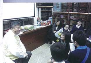
壽衣店老闆與同學分享中國殯葬的禮儀與文化