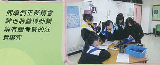
同學們正聚精會神地聆聽導師講解有關考察的注意事宜