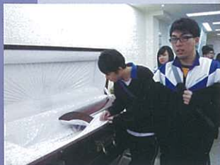
除了有木棺材外，也有紙棺材

我認為是次活動讓我了解對身後事的認識及重要性，有助了解本地殯葬行業的現況，讓我重新感受生命是一份喜悅。