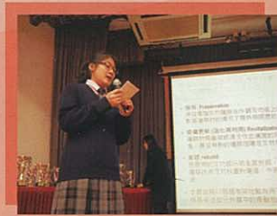
同學在台上與一眾嘉賓分享冠軍作品