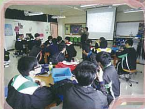
各組同學積極回應導師的提問