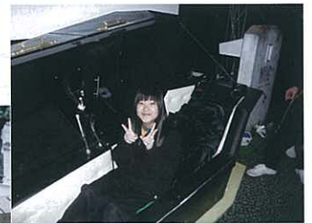
不少人死後也不知道會發生甚麼，現在我未死已知道了！