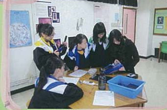
導師向同學示範如何使用不同的考察量度工具