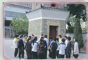
學生於聚星樓前熱烈地回應導賞員的提問

承蒙古物古蹟辦事處派出的導賞員協助下，學生於當天考察了文物徑沿線的獨特古蹟包括香港唯一的古塔聚星樓、本港最大的祠堂之一鄧氏宗祠、古老圍村上璋圍及專為村中子弟準備科舉考試而建的觀廷書室。