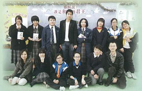
同學跟天航(後排左四) 訪問後大合照

除此以外，本校早前亦有幸邀得現已移居台灣的作家天航到校，接受作家計劃同學訪問，而這活動吸引了不少未有加入作家計劃的同學旁聽。天航跟同學分享在香港及台灣寫作小說的苦與樂，同學也把握機會爭取跟天航合照和簽名留念呢！