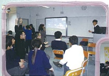
在手語比拼環節，同學須使用手語與組員溝通，從而促進他們協作及表達的能力。