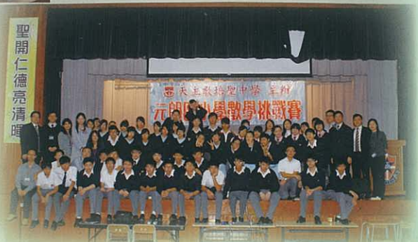
「元朗區小學數學挑戰賽」籌辦委員會及工作人員全體合照