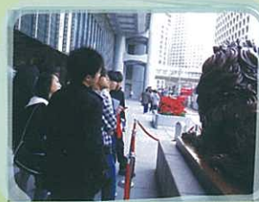
滙豐門外的獅舞見證香江歲月變遷