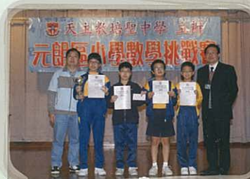
季軍：光明英來學校