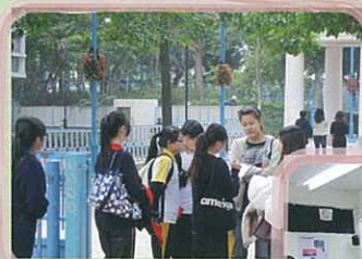
同學正進行問卷調查

參與的學生表示，這一次戶外考察探究使他們能學以致用，而透過這次的學習經驗，更助培養他們的批判思考能力。