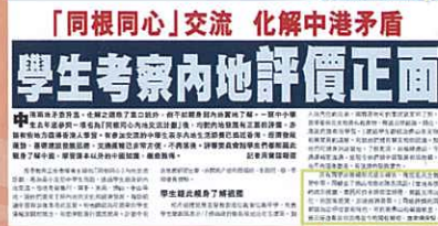
2月19日成報港聞報道