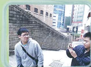
同學對中西區歷史建築深感興趣，拍照拍過不停