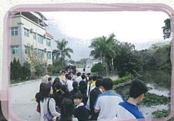
學生正了解近年本港圍村的防洪設施