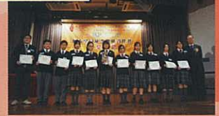
冠軍組別的同學在台上與嘉賓合照