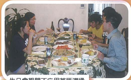
生日會期間不忘用英語溝通