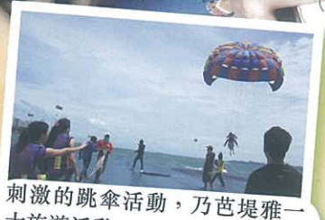
刺激的跳傘活動，乃芭堤雅一大旅遊活動。