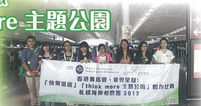
札幌之旅出發前留影

http://hk.apple.nextmedia.com/realtime/news/20130713/51555569