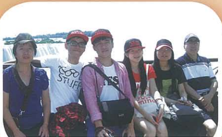
與陳校友伉儷參觀尼加拉瓜大瀑布 (Niagara Falls)。瀑布氣勢磅礴，嘆為觀止！