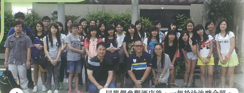
同學團在泰國遊學後，一起於車站合照。