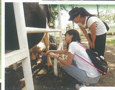
同學體驗搾牛奶活動

日本的垃圾筒把垃圾分得十分仔細，分可燃及不可燃的廢物，途中我們亦有參觀當地快餐店的垃圾分類，更發現有冰粒的分類。當地人會自行把吃剩的垃圾放入垃圾筒，十分守紀律，值得我們學習。