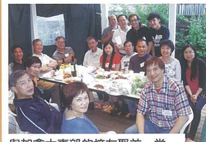
與加拿大東部的校友聚首一堂

After the stay, the students are now more confident in speaking English and they have more understanding of the life of studying abroad.