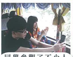
同學參觀了不少人工景點，其中一個便是野生動物世界。