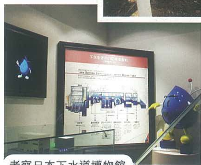
考察日本下水道博物館

日本的下水道科學館既有教育意義又十分有趣，只需要按下按鈕，就會有聲音解說及動畫指導，令人能陶醉於動畫之餘，亦能學習污水處理過程等問題，十分吸引遊人參觀。