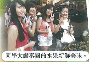
同學大讚泰國的水果新鮮美味。