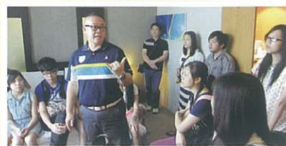
同學聚精會神，了解酒店業的運作模式及情況。