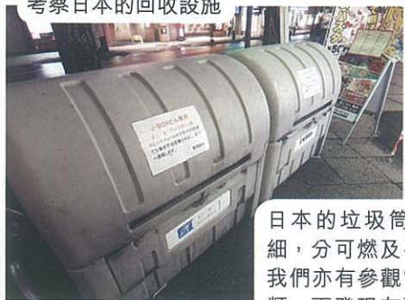
考察日本的回收設施

日本的垃圾筒把垃圾分得十分仔細，分可燃及不可燃的廢物，途中我們亦有參觀當地快餐店的垃圾分類，更發現有冰粒的分類。當地人會自行把吃剩的垃圾放入垃圾筒，十分守紀律，值得我們學習。