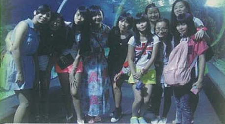
在暹羅海底世界水族館中，同學近