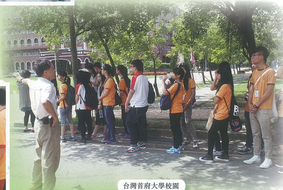
台灣首府大學校園