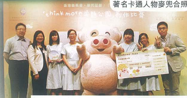
同學和師生與著名卡通人物麥兜合照