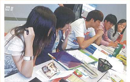
上課時同學認真地討論及分享