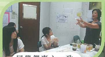
同學們專心一致，細聽泰北蜂蜜研究中心人員介紹如何分辨出優質的蜂蜜。