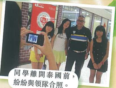
同學離開泰國前，紛紛與領隊合照。