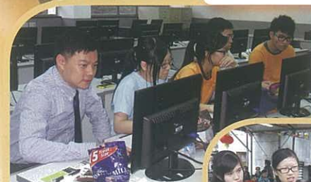
師生一同製作和處理後期影片製作