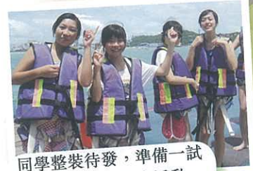
同學整裝待發，準備一試芭堤雅著名的跳傘活動。