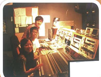
參觀馮錦聯校友工作的電視台，同學對電視台有更深入認知。