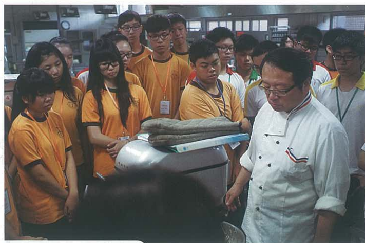
參與台灣首府大學體驗課堂