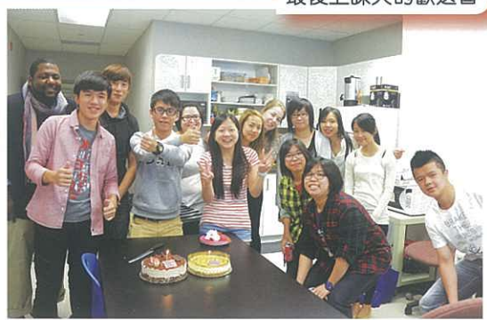
最後上課天的歡送會

除了一般課堂活動外，同學還可以透過學習打高爾夫球、進行運動競技、與其他當地小朋友一起參加活動，學習日常英文用語。