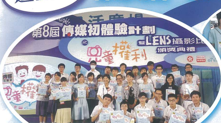
比賽由資深傳媒人立法會議員毛孟靜擔任頒獎嘉賓