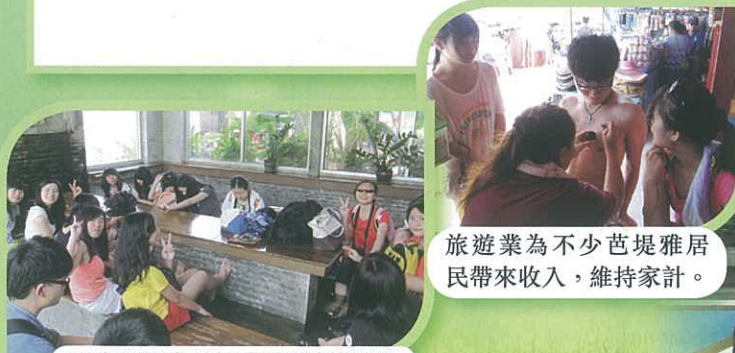
旅遊業為不少芭堤雅居民帶來收入，維持家計。