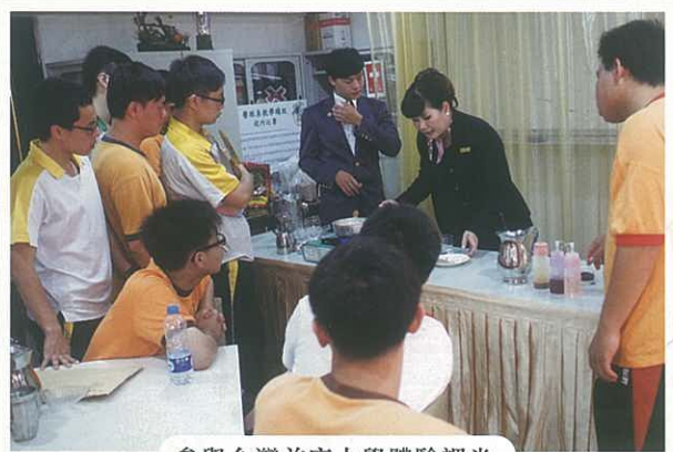
參與台灣首府大學體驗課堂