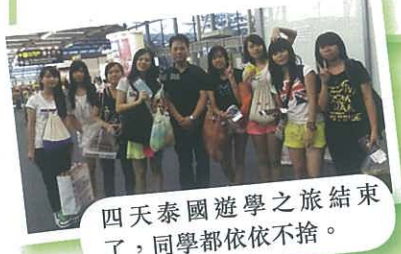
四天泰國遊學之旅結束了，同學都依依不捨。