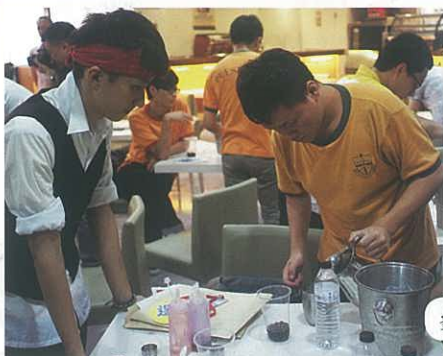
參與台灣首府大學體驗課堂