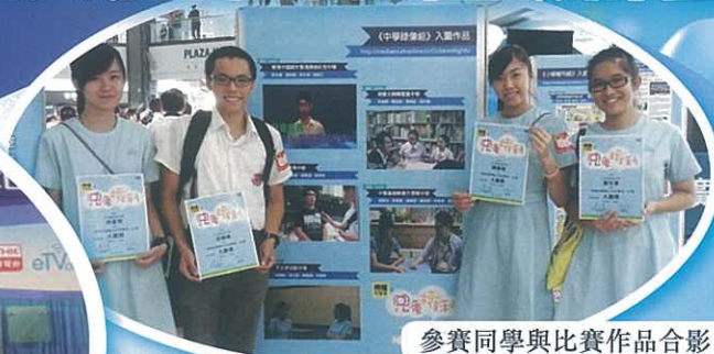
參賽同學與比賽作品合影

本校通識科及公民教育組參加由香港電台教育電視 eTVonline 主辦的「第八屆傳媒初體驗計劃」。本校同學以時事新聞採訪及報道的形式，製作有關兒童權利的影片，並獲得優異獎。