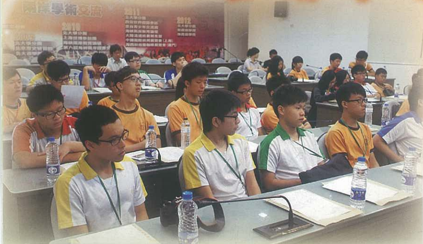
同學出席台灣首府大學交流會

本組與歷史科及地理科合辦的台南學習之旅已於2013年7月2-5日順利完成。活動共有36位高中學生參加，在四天行程中，學生參觀了台南安平古堡及前英國領事館等歷史古蹟；又探訪了鹽田及紅樹林等自然及環保景點。本校為了同學升學做準備，更安排他們參觀台灣首府大學，進行研修活動。在交流活動中，學生每天除了完成學習行程之外，也需要進行反思討論及完成特定學習手冊，這些活動加深了學生對台灣城市建設、農業及自然保育的認識。