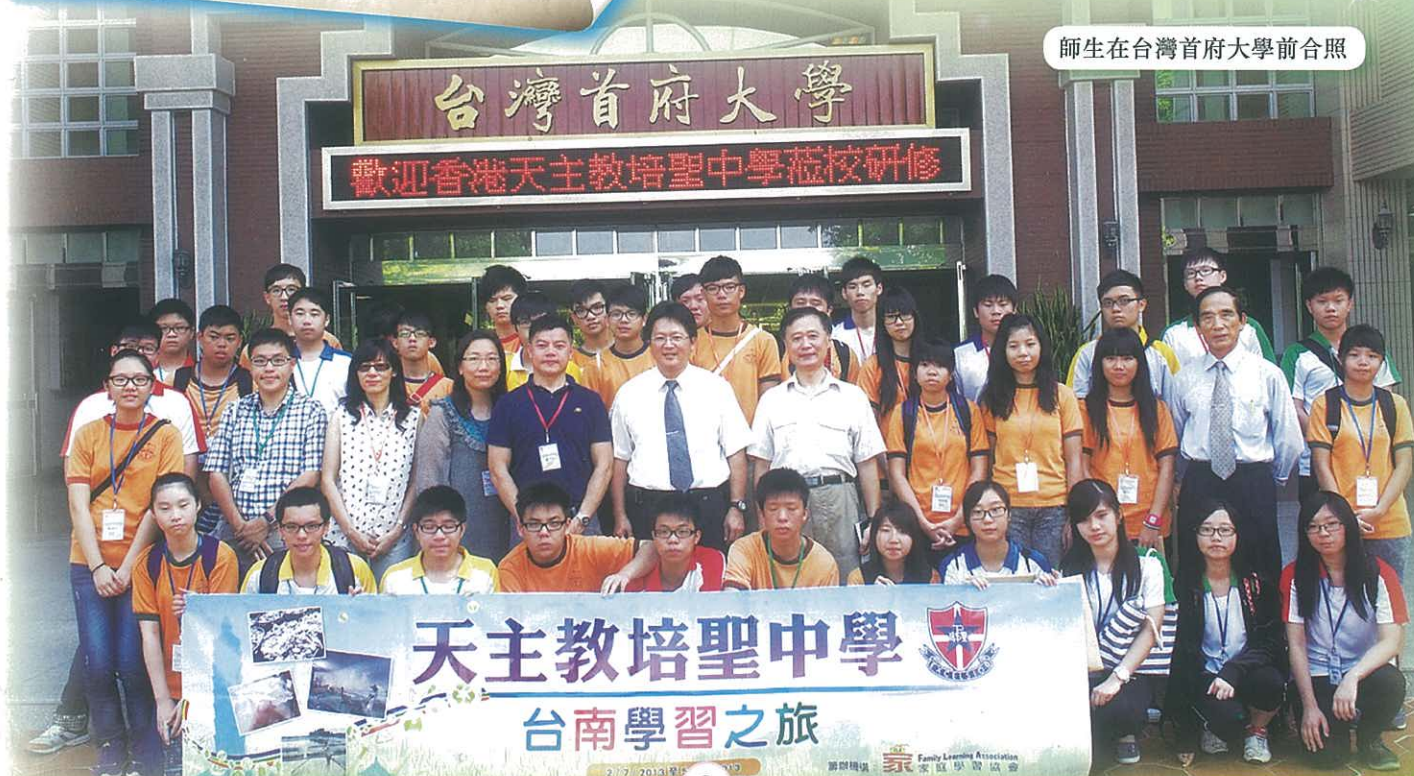
師生在台灣首府大學前合照