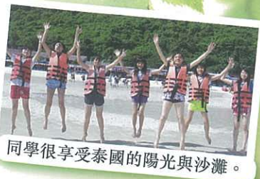
同學很享受泰國的陽光與沙灘。