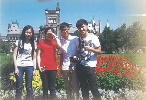
參觀多倫多大學 (University of Toronto)