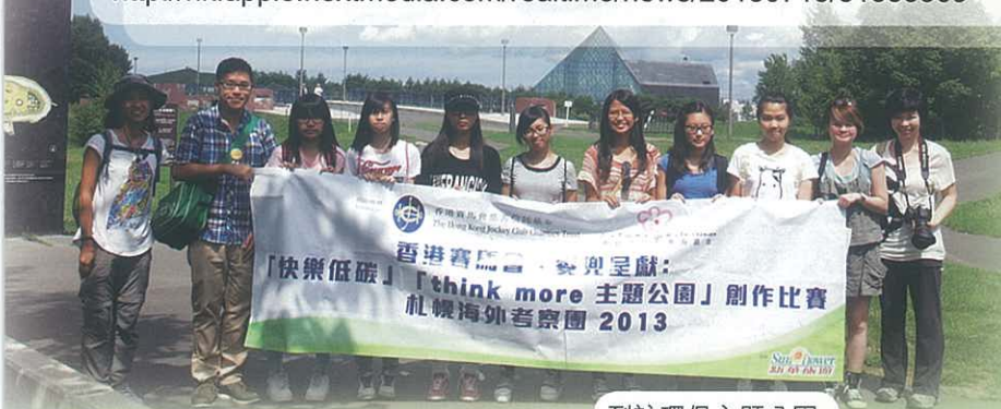
到訪環保主題公園