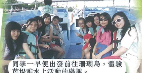
同學一早便出發前往珊瑚島，體驗芭堤雅水上活動的樂趣。