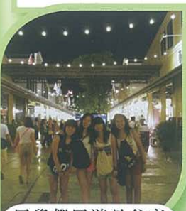
同學們同遊曼谷夜市，感受當地的夜生活。