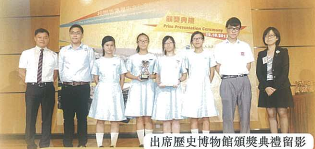
出席歷史博物館頒獎典禮留影