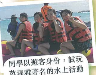
同學以遊客身份，試玩芭堤雅著名的水上活動「香蕉船」。