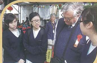
採訪著名歷史學者夏思義