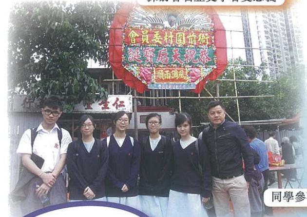
同學參觀衙前圍村