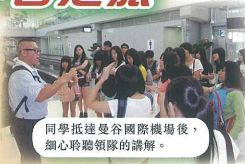
同學抵達曼谷國際機場後，細心聆聽領隊的講解。