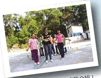
多謝各位欣賞我組的自我介紹！