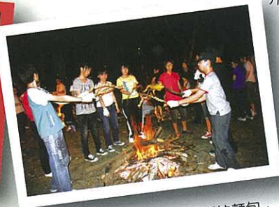
熊熊烈火。我們正在燒「樹枝麵飽」。