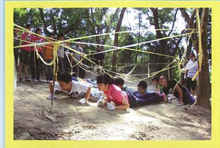
今次真是「五體投地」了。