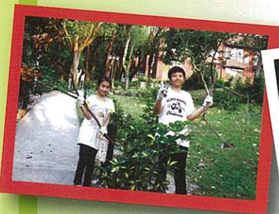
拾好柴枝，準備生火。

每組獲派定量烹飪燃料：火柴三枝、炭精一粒、報紙一張。每組均需烹調四款指定食物：原隻燒雞、樹枝麵飽、洋蔥焗蛋、炒蛋。在指定時間內完成的組別，每人可獲獎腸仔二條、豬扒一塊、麵包一個以作獎勵。