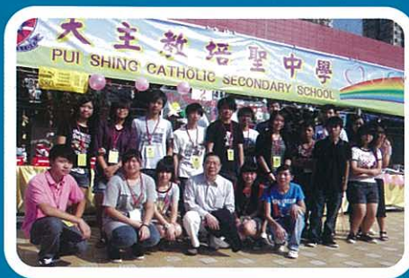
工作人員來個大合照！