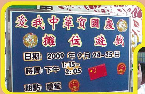
愛我中華賀國慶攤位遊戲活動

是次活動於2009年9月24-25日舉行。我們透過不同類型的攤位遊戲如「運動選手大比拼」、「大件事·關我事」、「拼出我中華」、「中國60年大事知多少圖文配對卡」、「擲人仔」等，希望同學可以認識祖國的著名建築、奧運選手、建國六十年的大事件、著名人物等，同學表現積極，反應熱烈。