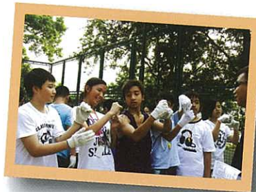
介紹組名，發揮創意。