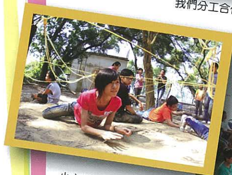
小心啊！不要觸及「電網」！