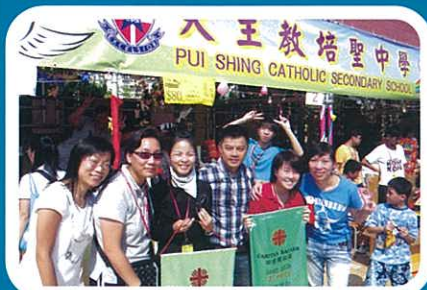
領隊老師，勞苦功高。