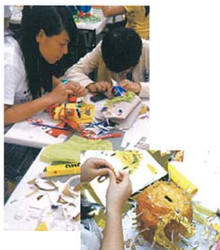
細意觀察，全情投入， 創作認真是成功的基礎！