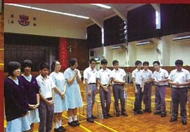
齊聲詠唱，同心禱告。