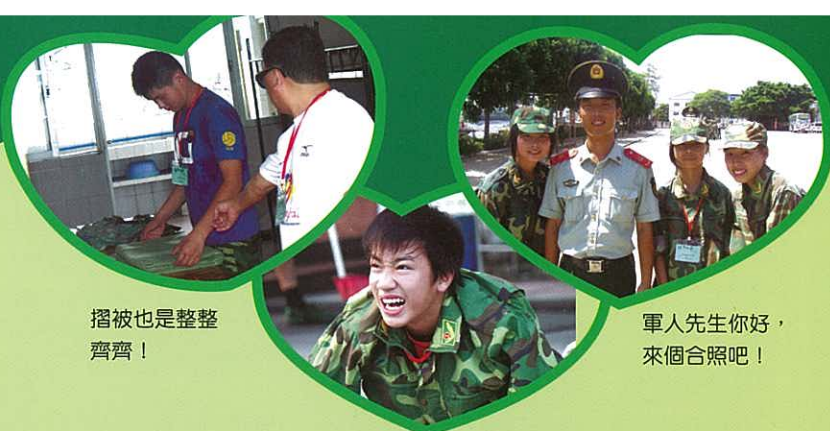
摺被也是整整齊齊！

本校同學參加由香港教育局及和富社會企業合辦的「同根同心軍事初體驗營」，一行人共11名師生前往廣州海警專業兵訓練基地，體驗軍人生活。參與學生除了接受步操訓練外，還可以觀看軍人訓練及氣功表演。另外，學生與軍人傾談的環節中，使他們更了解軍隊的運作。