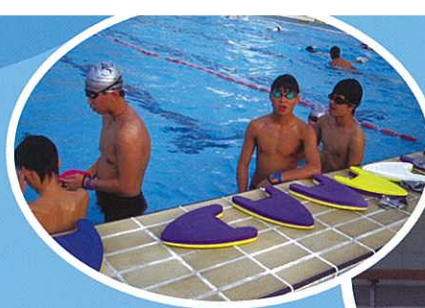
備戰元朗區學界游泳比賽

泳隊已於9月8日進行選拔。本年一共有25名同學成為泳隊隊員，並於9月中開始進行定期練習。