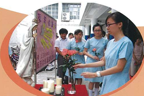
獻上鮮花，表達敬意。