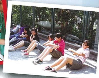
哎呀！下次一定要準時集合！