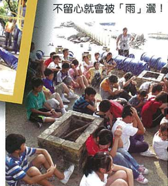
不留心就會被「雨」灑！