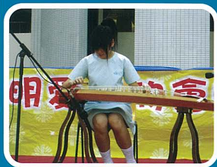
古箏琴韻，樂聲悠揚。