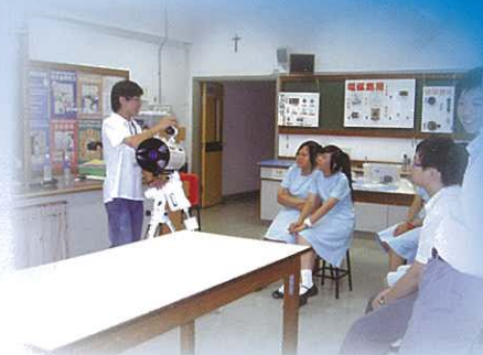
全神貫注，聆聽講解。