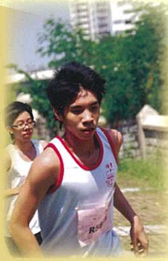
專心一志，心無旁騖。