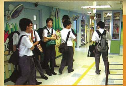
4D考察智障小朋友中心