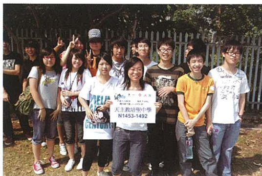
我們也為繪畫出一份力！

「高中學生成長組」於17/10帶領中四級學生到濕地公園，與另外1,900名參加者參與「鳥類與濕地」攜手繪出健力士世界紀錄活動。學生透過此活動，除可增加「藝術發展」之經歷外，對保育濕地和鳥類的認知亦有提升。