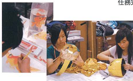
透過不斷的探索和實驗，激發無限想像和創意！