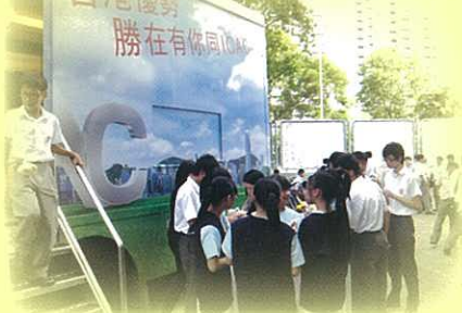
同學對廉政公署流動車充滿興趣

2009年10月30日宗教德育組邀請了廉政公署流動車到校進行展覽，當中不少關於ICAC的資訊，亦有不少關於倡廉的遊戲，希望同學可以從中明白廉潔和倡廉的重要性。