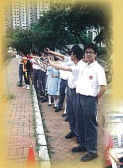
Are you ready?