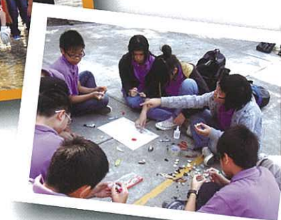
我們分工合作，完成任務。