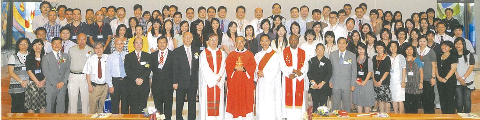
全體合唱「全因為你」，歌聲響遍聖堂每一個角落