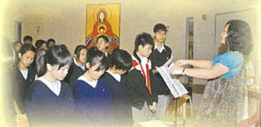
歌詠團帶領同學詠唱聖詩