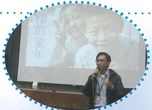
講者與同學分享訊息。

2008年11月14日宗教德育及公民教育組與輔導組邀請宣明會為中二級同學進行生命教育講座，主題為「不一樣的童年」。我們希望同學藉此學懂珍惜現在的一切，培養不要浪費的態度。