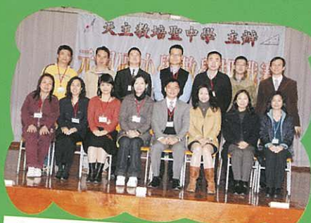
「元朗區小學數學挑戰賽」籌辦委員會全體老師合照