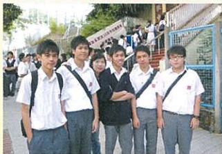
同學在會場門外合照。

2008年11月8日本校共有5位中六同學參加了由國民教育中心舉辦的「改革開放三十年問答比賽」。參賽共有500多位同學，競爭十分激烈。