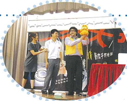
同學也客串登場，到底他們在做甚麼呢？

2008年10月3日宗教科邀請了廉政公署為中四級同學表演倡廉互動劇，讓同學在輕鬆愉快環境下，明白甚麼是廉潔和貪污的禍害。