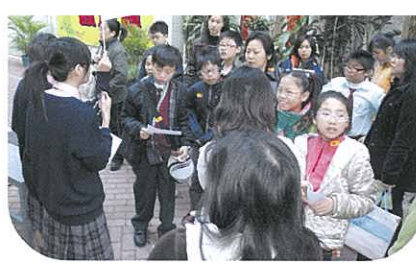
學生大使準備帶領參觀者遊覽校園。

本校於11月29日接待由元朗區家長教師會聯會安排的「升中觀校日」參觀團隊，當天早上約有一百八十位小學家長及學生到本校參觀。學校派出學生擔任導賞員，帶領他們參觀本校校園；行程包括參觀設計與科技室、視覺藝術室、學與教資源中心、生物實驗室及家政室等，讓他們了解本校設施及觀看學生作品，同時在家政室內品嚐由學生製作的曲奇餅，場面輕鬆愉快，最後由關中明校長、潘永強副校長及劉廣業教務主任向參觀團隊介紹本校特式及新高中學制。