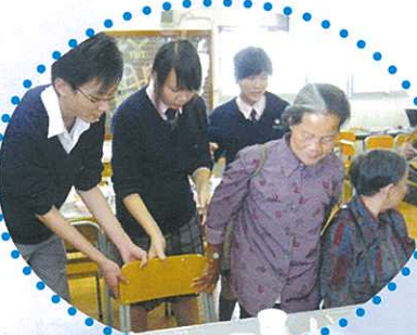
同學為老人家拉椅子，真細心。