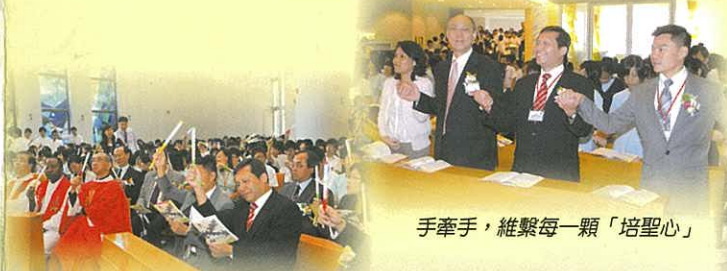
手牽手，維繫每一顆「培聖心」