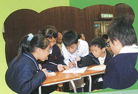
參賽學生全情投入，熱烈討論，享受比賽。