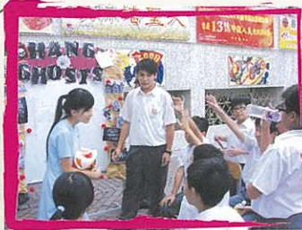
「我答！我答！」 同學都舉手踴躍回答問題。