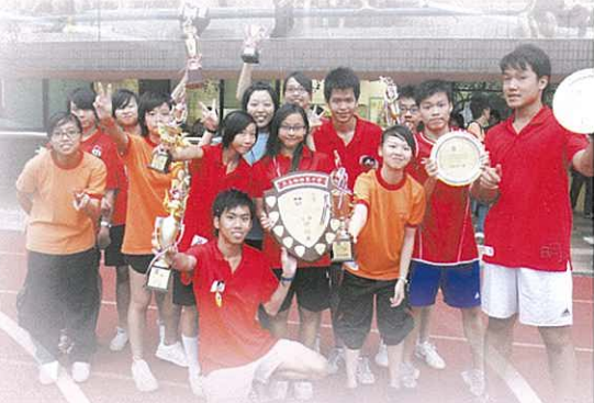
明舍蟬聯冠軍，一眾舍幹事喜上眉梢！