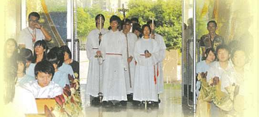
學生擔任輔祭，彌撒正式開始