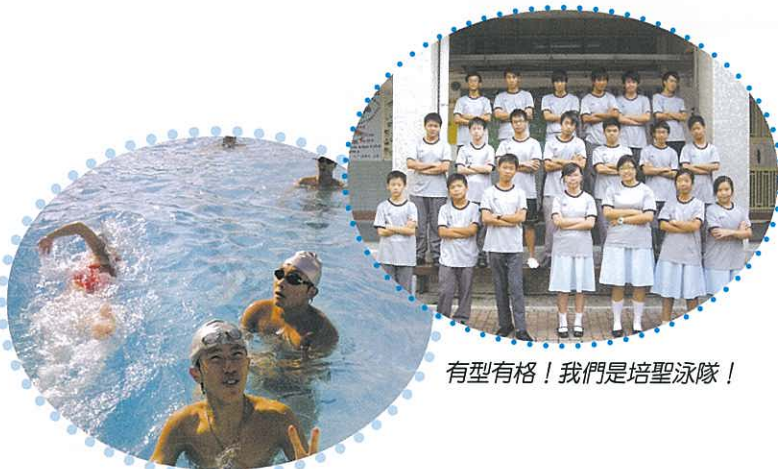
有型有格！我們是培聖泳隊！

泳隊已於2008年9月9日進行選拔。本年一共有25名同學成為泳隊隊員，並於9月中開始進行定期練習。