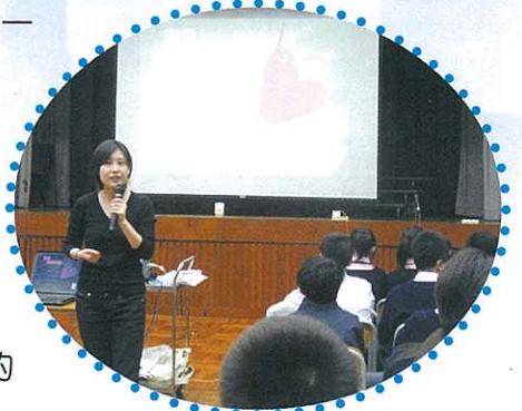
同學專心聆聽講者分享。

宗教德育及公民教育組與輔導組分別於2008年12月4日及12月11日，邀請了母親的抉擇及香港明愛為中一至中二級及中四至中七級同學進行性教育講座。我們希望中一、二同學從中明白到戀愛和性的正確態度；而中四至七級同學則明白到婚前性行為所帶來的後果。