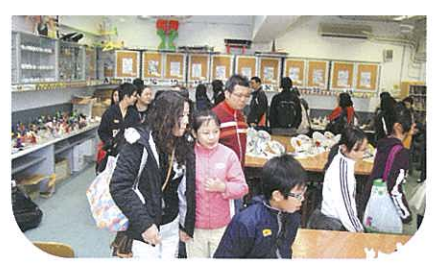
這是視藝室，參觀者正欣賞同學的作品。