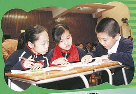
參賽學生聚精會神，分析題目。