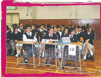
同學正在進行英文科問題比賽。