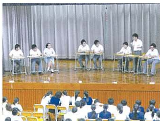
兩閣在答問大會上雄辯滔滔。

當日投票率接近六成，最後「聯合國」以十數票之差勝出，在此賀「聯合國」獲選今屆為學生會。