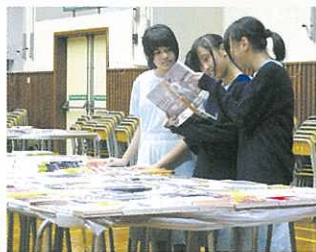
大家來看這本書吧！十分有趣！

由國民教育組與學與教資源中心合辦的國慶月書展於10月22日至10月23日在禮堂舉行。以培養同學的閱讀興趣及自學習慣。書展期間，還舉辦了「購書（金額）最多」及「購書（本數）最多」比賽，同學均積極參與。