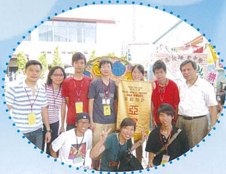
我們獲「攤位遊戲設計」亞軍呀！來個大合照吧！

宗教及公民教育組於2008年11月2日(星期日)參加了2008年屯門明愛賣物會，並榮獲「攤位遊戲設計」亞軍。本校共有40多位同學在11月1及2日為攤位佈置及售賣貨品盡心盡力，最後共籌得15000多元善款，充分表現了培聖人熱心落力的精神。