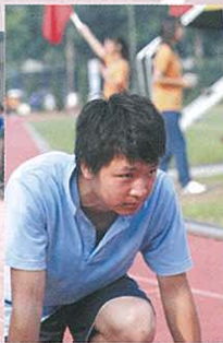
聚精會神，為舍增光。