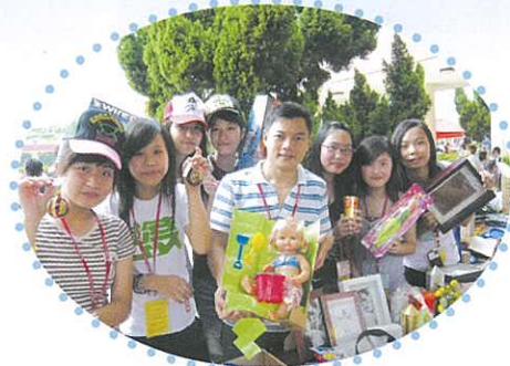
快來賣吧！共襄善舉！