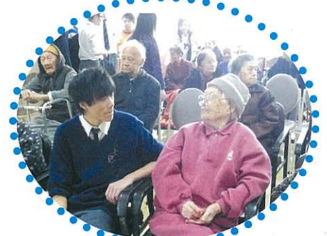
同學與老人家聊天。