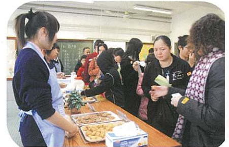
這是我們自製的曲奇餅，請大家嚐嚐吧！