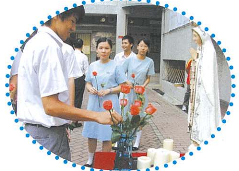
同學手執鮮花，向聖母致敬。

十月是玫瑰月，我們為了表示對聖母的尊敬和敬愛特別在10月24及25日，在早會邀請各班班長向聖母獻花。同時，校長於10月24及25日午膳，偕一眾同學誦念玫瑰經。