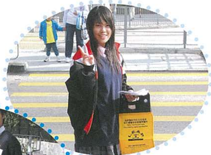
小朋友賣旗後與同學合照。