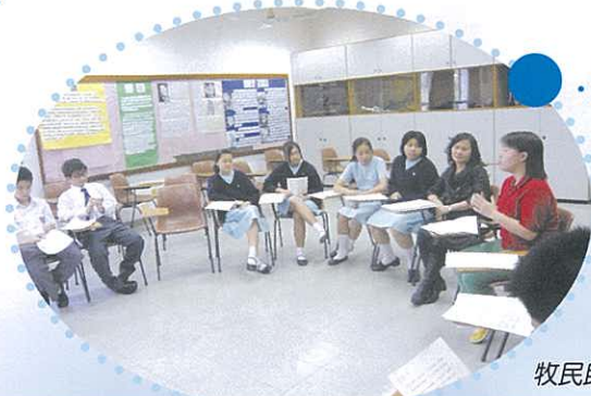
牧民助理帶領同學祈禱。

十一月份是天主教的煉靈月，我們在這個月份除了在早會特別為四川的死難者和身邊亡故的親友祈禱外，也舉行午間祈禱會，希望所有亡者可以早日回到天父的懷內，得到安息。