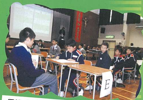
甲部 - 個人項目比賽