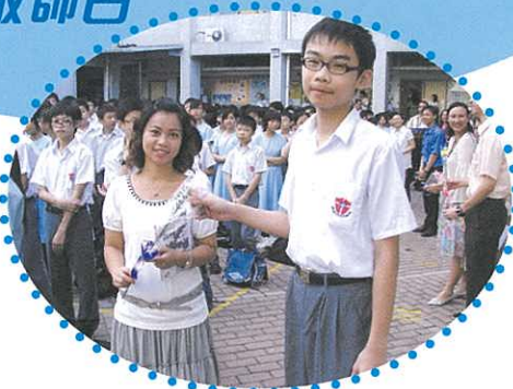
學生向老師致送花朵以表心意。