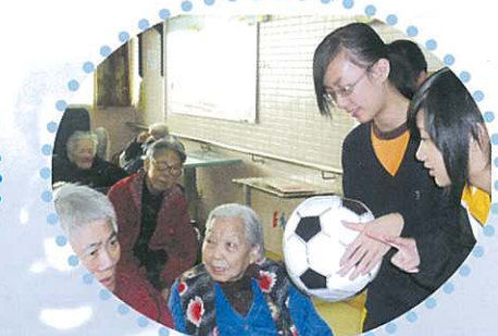
老人家也踢足球？不！這是遊戲之一而已。