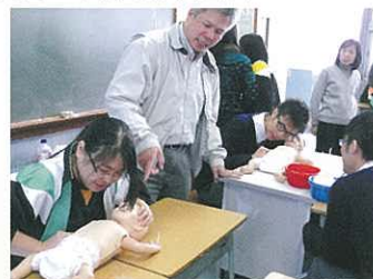
導師指導同學進行兒童心肺復甦法。