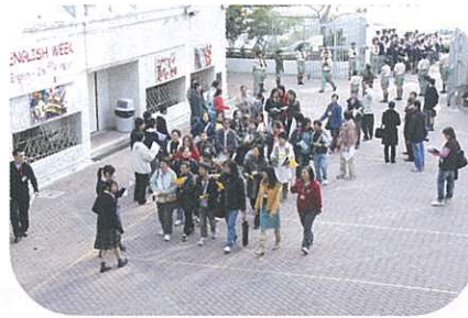
參觀者到場，董軍及學生大使在門外歡迎。