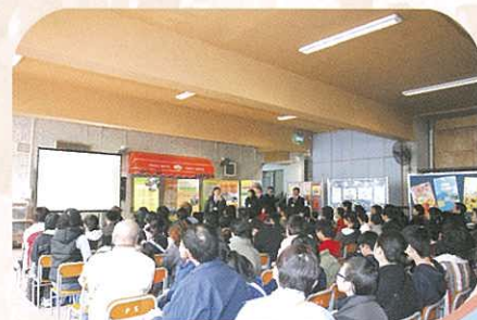
家長及學生參加我校新高中學制講座。