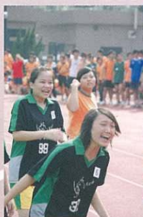
德舍舍員為接力隊打氣，七情上面。