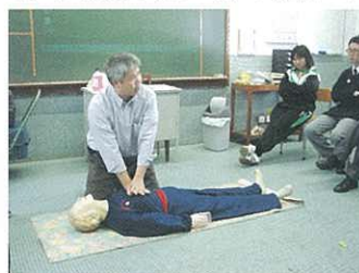
同學用心觀察導師示範。

聖約翰救傷機構與本校協辦之急救證書課程訓練班在11月份開展，除教授急救知識和技能外，還有人工呼吸心肺復甦法。