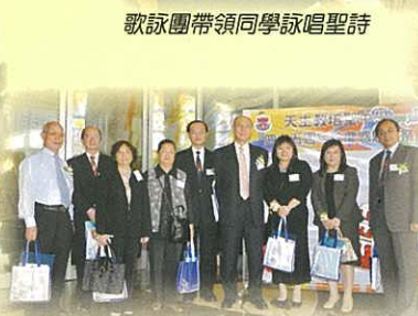
嘉賓在聖堂門外合照