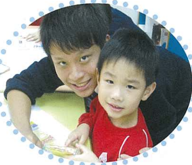
小朋友真可愛，我們一起拍照吧！

同學更到聖公會夏瑞芸幼兒學校，與小朋友一同玩遊戲，教授小朋友德育知識，讓小朋友從活動中認識環保、有禮等的道理。