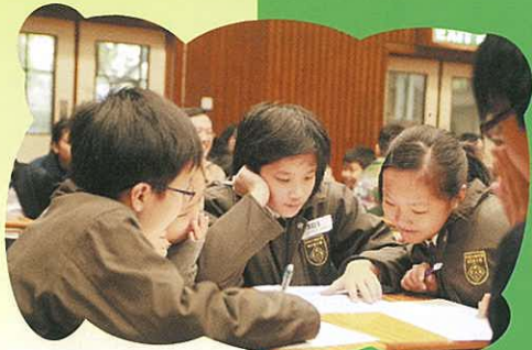
參賽學生全力以赴，盡展所能。