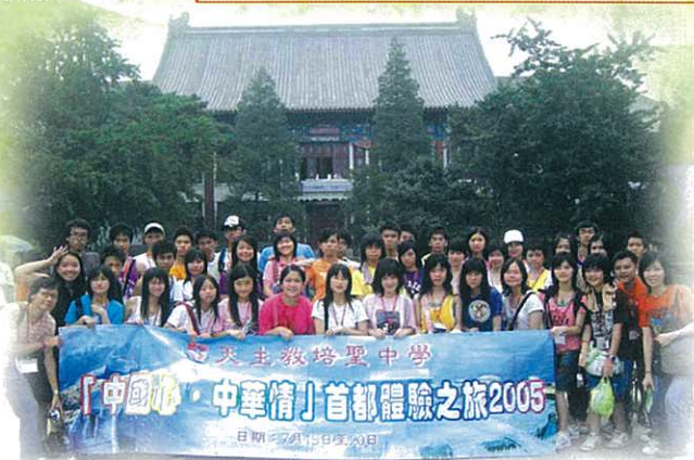
交流團師生於北京大學留影

暑假甫開始，本校中四及中六 40 名同學在老師帶領下，往北京遊覽及跟當地中學生交流。六天的行程十分緊湊，除開拓本校同學的視野，令他們一睹首都風貌外，更讓他們親身接觸北京中學生，全面加深他們對中國的認識。今次旅程使他們獲益良多。可惜名額有限，不少同學無緣隨行。期望不久將來，更多本校同學有機會參加同類活動。