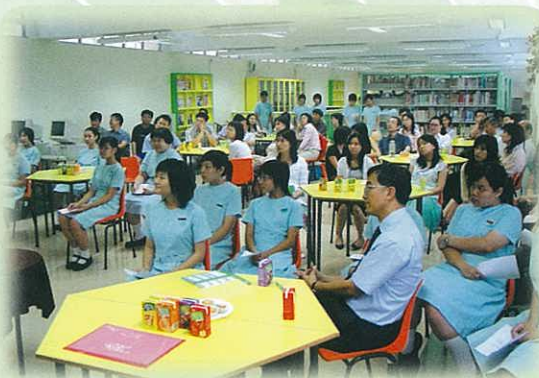
中心空間調配靈活，可供 舉行小規模講座。