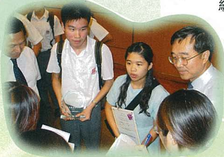
同學代表接受記者採訪