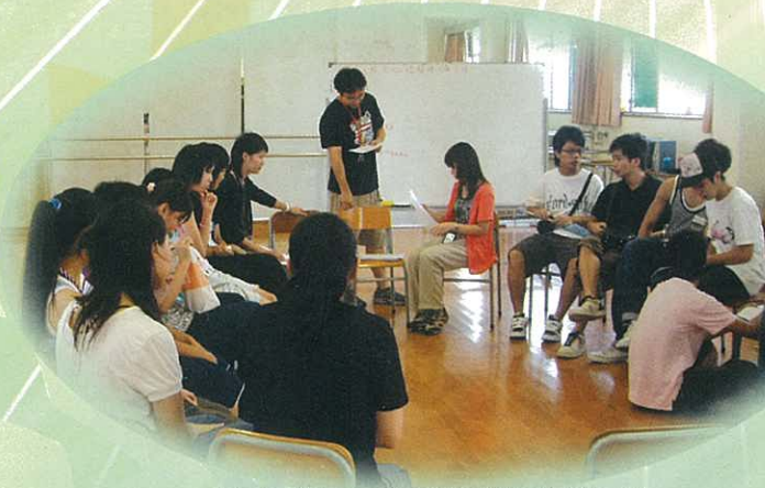
參加同學細心聆聽導師講解輔導理論