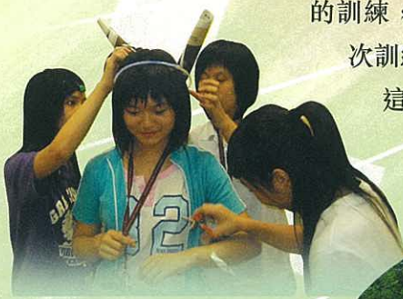
齊心為「嫦娥」裝扮，共闖野外定向。