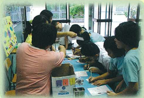
家教會委員於午膳時設立攤位， 收集寫滿同學心意的敬師卡。

在開學初的早會上，家長教師會主席及委員上台致辭，鼓勵同學尊敬老師，認真學習；並藉機致送禮品予老師，實踐家長也敬師。