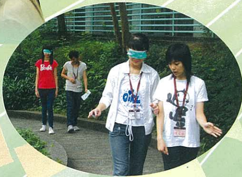
蒙眼走路——有助同學建立互信、互助