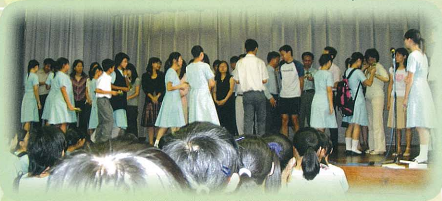
各班代表在敬師日上台給老師獻花