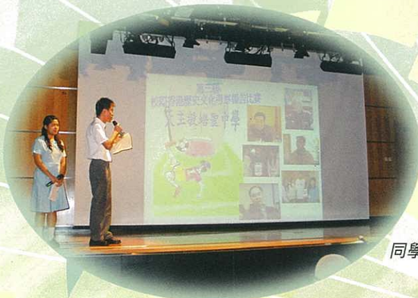
同學代表即場簡介報告