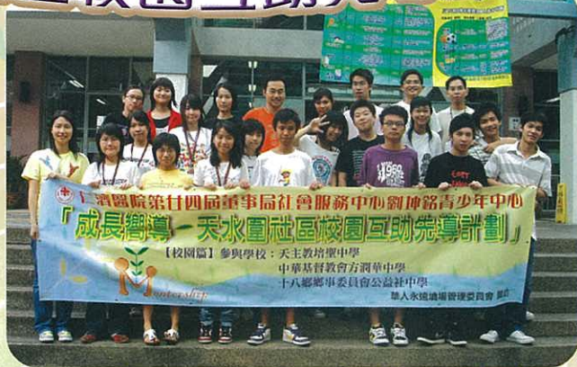
輔導組老師與「滿載」而歸的先導計劃學員合照留念

二十多位中四同學在本年暑假參加了由仁濟社區中心籌辦的「成長嚮導——天水圍社區校園互助先導計劃」。活動目的在訓練中四同學作輔導員，協助中一同學適應校園生活。期間同學接受有關輔導技巧的訓練，包括六節理論課和一次訓練營。參加同學均認為這活動既能充實自己，又可得到滿足感。