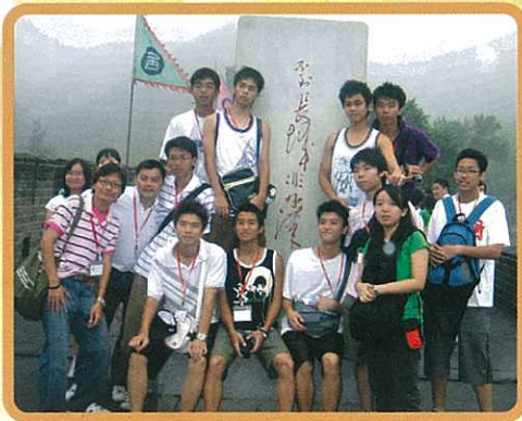
一登長城，便成好漢。