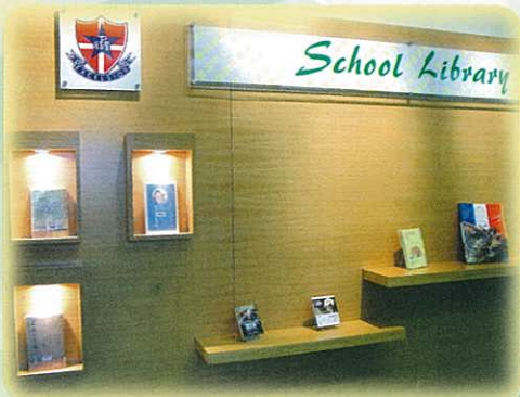
裝修後的學與教資源中心色彩 配搭得宜，令人耳目一新。