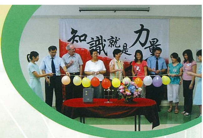
學與教資源中心祝聖禮成，校監、校長、 家教會成員主持啟用儀式。

為配合課程改革，我校圖書館重新定位，易名為「學與教資源中心」，並斥資逾十一萬元進行全面翻新工程。內裡分為視聽、電腦、展覽、升學及就業資訊、教師資源及課程展覽等多個專區，可舉行小規模講座及供師生借用。