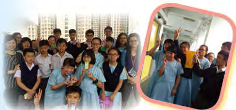
校園壓力 GO GO GO（校園定向） 4月21日及 4月25日