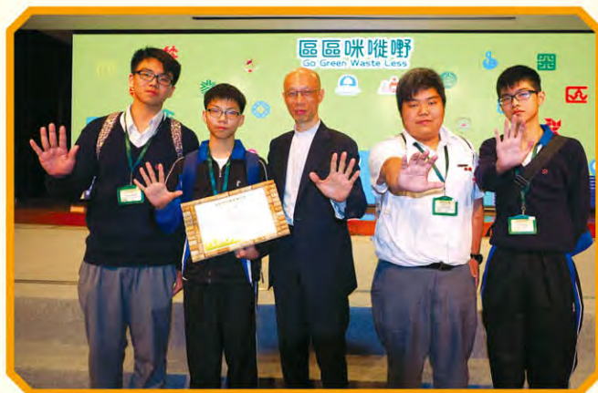
與環境局局長黃錦星一起宣誓節約減廢