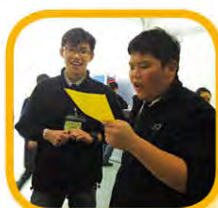
「心晴加油站」- 拋出彩虹活動 1月22日