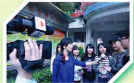
同學接受黃江電視訪問