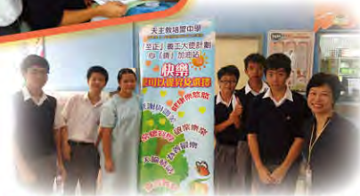
「心晴加油站」- 心意卡活動 11月6日