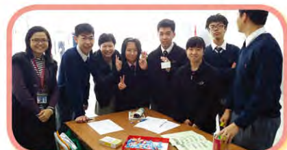
「心晴加油站」- 急口令活動 1月8日