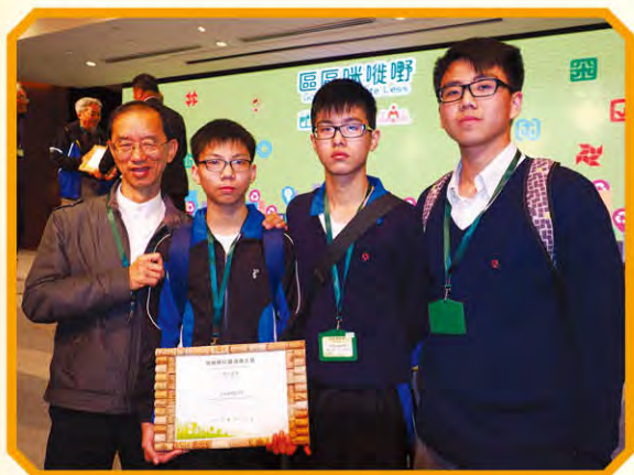
同學與環運會林超英主席合照

本校一向推廣環境教育不遺餘力，全體師生亦積極參與校內外的環保工作。本年度，本校參加環境運動委員會、環境保護署、教育局舉辦的學校回收教育活動「咪咗嘢校園減廢大獎」，並獲得「積極參與嘉許狀」。公益少年團代表與老師已於2015年4月10日到香港會議展覽中心出席「區區減廢咪咗嘢」高峰會及頒獎禮，接受主辦單位的嘉許。