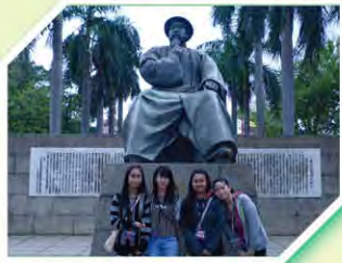
同學於林則徐雕塑前留影

由綜合科學科及公民教育組舉辦的「體驗賽車學環保——東莞、肇慶交流團」已於3月17至19日順利完成。是次交流的目的是為了讓學生認識國內汽車工業發展及汽車與環保關係之概況、提升對機械和科技的認識及興趣、了解國內賽車道概況、認識國內學生學習情況及與國內學生作交流。