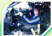
賽車也可以 CHOK 啊！