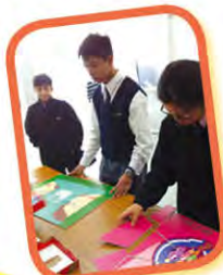
「心晴加油站」拼出 心情活動 1月29日