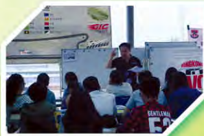
齊學習賽車與環保