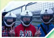
要上賽車了，很緊張啊！