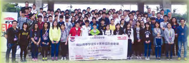
與黃江第一中學師生大合照