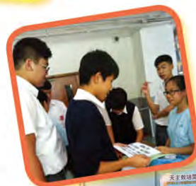
「心晴加油站」- 心理健康活動 4月30日

本計劃旨在學校推動人與人之間互相體諒和關懷的精神，建立一個共融和諧有希望的校園。活動為一整年的培訓課程，如午間活動（以舒緩壓力為主題的「心晴行動」）、校園壓力 GO GO GO（校園定向及調查本校各同學壓力的「心情・心晴話你知」活動），義工培訓——組織及服務日營、推廣關愛校園文化的「校園和諧日」攤位遊戲活動及迎接各中一學生的「關愛校園大傳送」活動等，以為學校建立一套有效率及持續的學長培訓計劃。