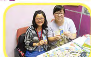
關愛校園大傳送（中一迎新）10月16日