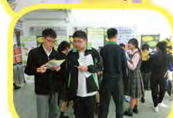
心情・心晴話你知 11月9至12日