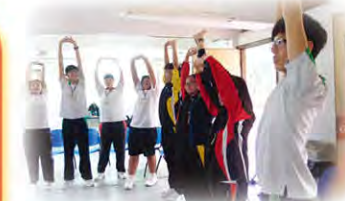
義工培訓——組織及服務日營 11月17日