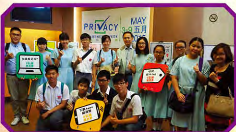
同學與個人資料私隱專員蔣任宏向合照