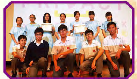
同學與個人資料私隱專員蔣任宏合照