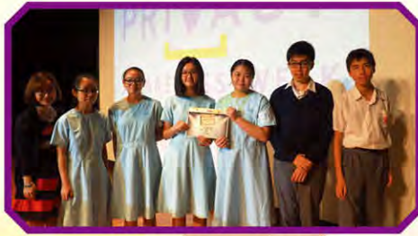
初中組：「社交網絡私隱」