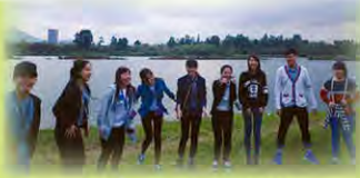
遊覽東莞松山湖，認識國內環保建設