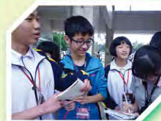
同學與黃江中學同學打成一片，交換微信！